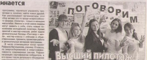
Участники тренинга в СОШ №11.

Она не испытывает потребности в умении сотрудничать со старшими коллегами в районной сети «Чай 7 лет Коль» и вступила в бой «Ребята» в 11 классе. И пусть они не выиграла! Но, и не проиграла! Команда СОШ №27 была замечена, названа самой молодой и уютной командой в проекте!