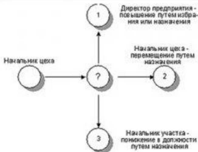
Рис. 5. Модель служебной карьеры «перепутье»