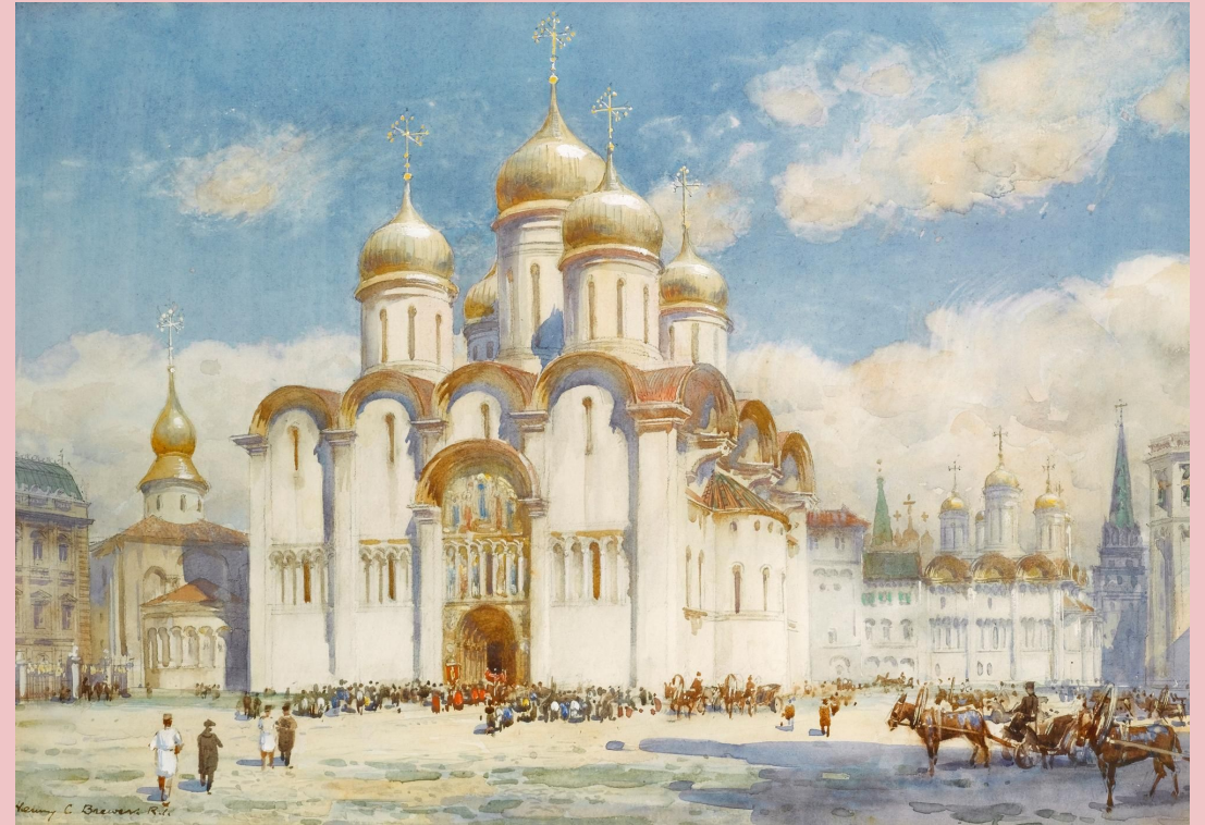
• Успенский собор