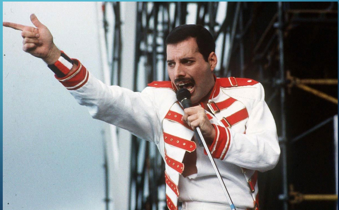
Лидер группы «Queen» Фредди Меркьюри