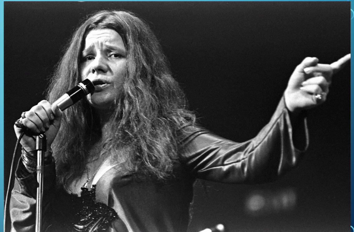
Королева блюза и рок-н-рола Дженис Джоплин