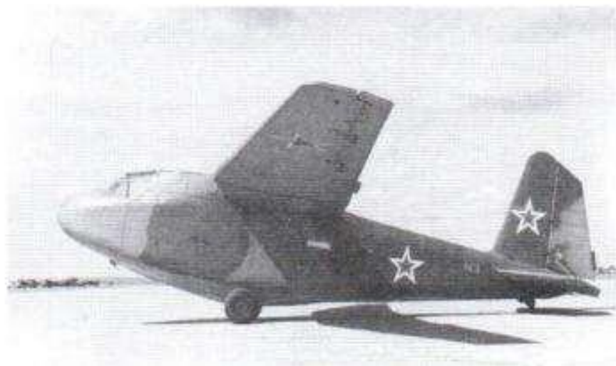
Планер Г-11, произведенный заводом № 463 (бывший завод № 168).