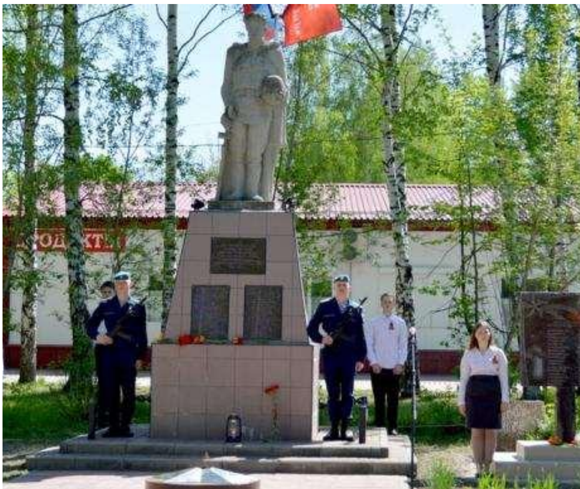
п. Варские – памятник «Женщине-Матери, детям войны и труженикам тыла»

Спасибо всем труженикам тыла за великий подвиг, совершенный во имя Победы. Это они в годы войны одержали Победу над фашизмом в тылу.