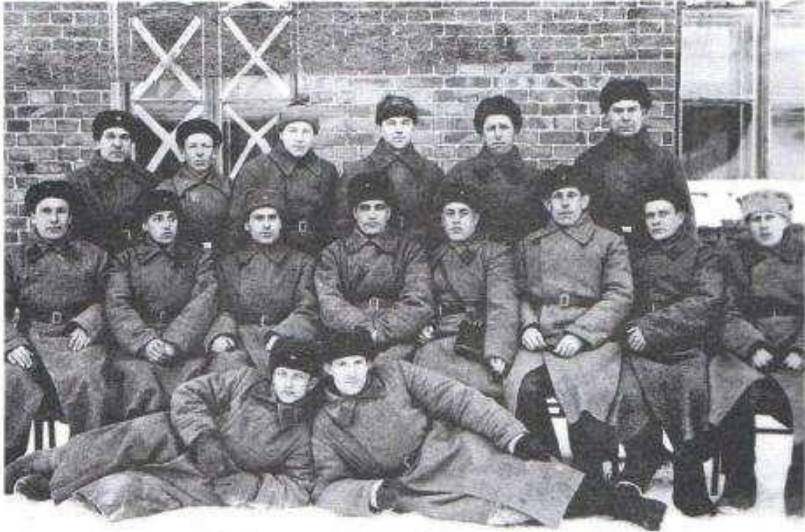
Рязанский добровольческий рабочий полк. Начало 1942 года.