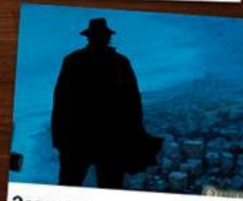
Загадка острова Роанок