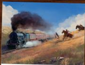
Где-то на Диком Западе