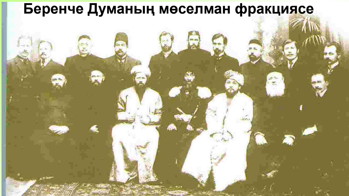
Беренче Думаның мөселман фракциясе