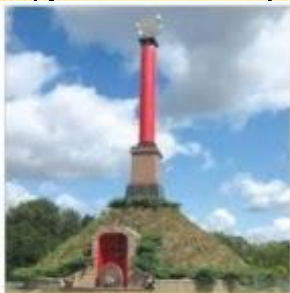
Меморіальний комплекс Крути в с. Пам'ятно (Чернігівська область)

У якому році відбулася подія, на місці якої споруджено цей меморіальний комплекс?