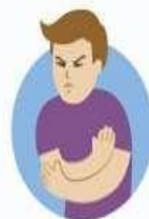
Боль в мышцах