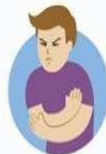
Боль в мышцах