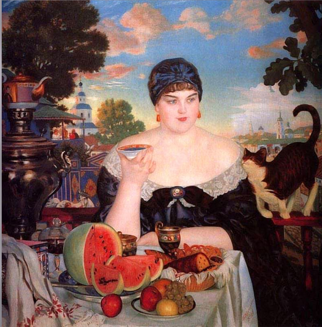
Б.М. Кустодиев Купчиха за чаем, 1918