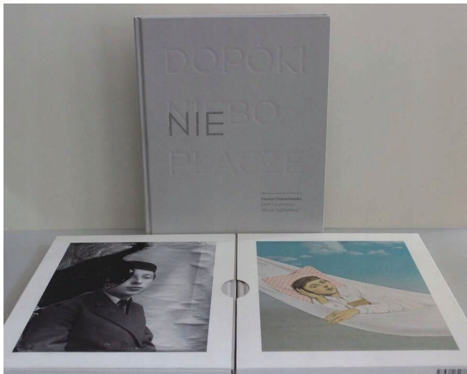
Ивонна Хмелевская «Покуда небо не плачет»

«Покуда небо не плачет» — еще одна поразительная книга Ивонны Хмелевской. Книга имеет следующую структуру: каждая документальная фотография сопровождается детским стихотворением, которые могли знать и читать маленькие клиенты фотографа, а затем художница предлагает свое художественное размышление, основанное на ее впечатлениях от увиденного.