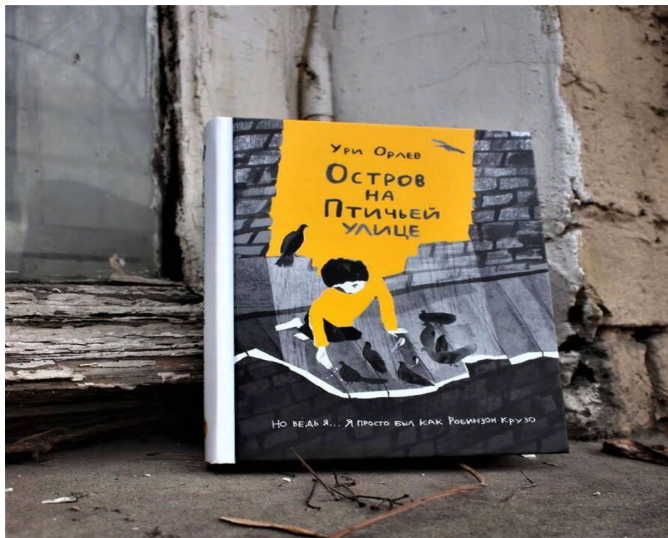
Ури Орлев «Остров на Птичьей улице»

Одиннадцатилетний Алекс с отцом живут в гетто. Сначала пропала мама, а потом немцы забирают и папу. У мальчика с папой был уговор — он должен ждать отца в полуразрушенном от бомбежек доме и никуда не уходить. Оставшись один, Алекс вынужден быстро повзрослеть. Рано утром мальчик выходит на поиски еды. Он знает всех жителей окрестных кварталов, а сам умудряется остаться незамеченным и становится городской тенью.