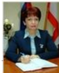
ИСАЙКИНА СВЕТЛАНА НИКОЛАЕВНА Заместитель главы администрации Сакского района