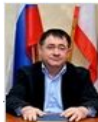
СЕЙТХАЛИЛОВ ДИЛЯВЕР СЕРВЕРОВИЧ Заместитель главы администрации Сакского района