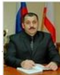
САННЭ ОЛЕГ НИКОЛАЕВИЧ Первый заместитель главы администрации Сакского района