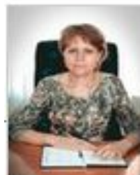
ШАПКИНА ЕЛЕНА АНДРЕЕВНА Заместитель главы администрации Сакского района