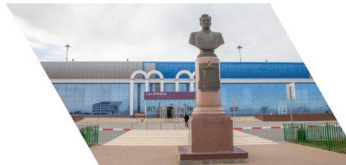
Международный аэропорт Махачкала (Уйташ) имени дважды Героя Советского Союза Амет-Хана Султана