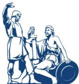
Общественная палата Российской Федерации CIVIC CHAMBER OF THE RUSSIAN FEDERATION

Общественная палата Российской Федерации