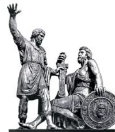
РОССИЙСКОЕ ИСТОРИЧЕСКОЕ ОБЩЕСТВО