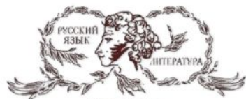
ОБЩЕСТВО РУССКОЙ СЛОВЕСНОСТИ