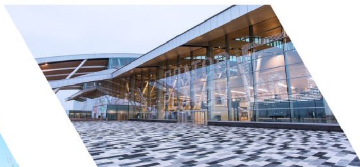
Международный аэропорт Ростова-на-Дону имени казачьего атамана Матвея Ивановича Платова