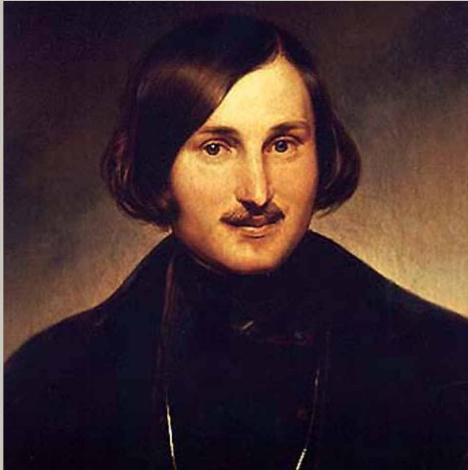
Н.В. ГОГОЛЬ 01.04.1809 — 21.02.1852.