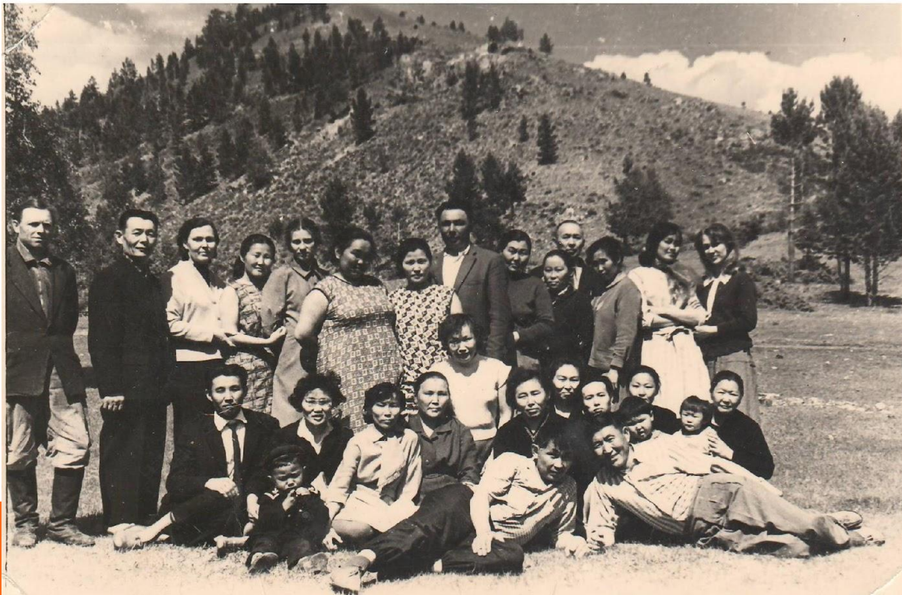
Шэбэртын дунда нургуулийн багшанар