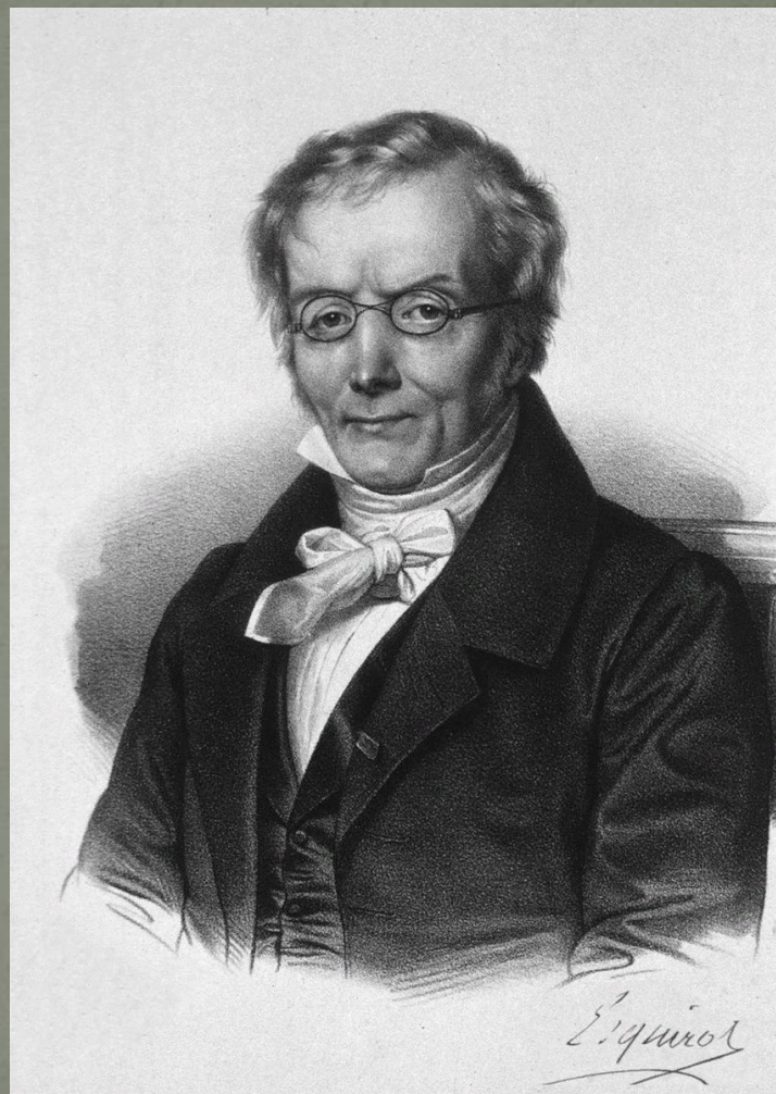
Жан-Этьен Доминик Эскироль

Ученик и последователь Пинеля Ж. Эскироль (1772 – 1840) продолжил дело своего учителя. Он потребовал вместо изоляции больных в тюрьмах помещать их в лечебные учреждения и обязательно проводить медицинские осмотры. Эскироль в труде «О душевных болезнях» описал отдельные симптомы психических заболеваний и подверг их определенной классификации.