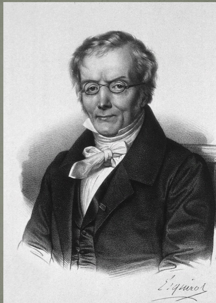
Жан-Этьен Доминик Эскироль

Ученик и последователь Пинеля Ж. Эскироль (1772 – 1840) продолжил дело своего учителя. Он потребовал вместо изоляции больных в тюрьмах помещать их в лечебные учреждения и обязательно проводить медицинские осмотры. Эскироль в труде «О душевных болезнях» описал отдельные симптомы психических заболеваний и подверг их определенной классификации.