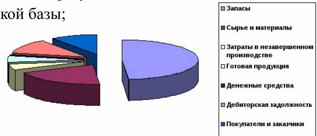
Рисунок 1.3 Структура Оборотного капитала