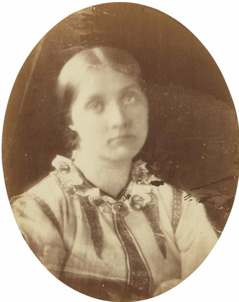
1864. Портрет Джулии Джексон, племянницы Камерон и матери Вирджинии Вулф