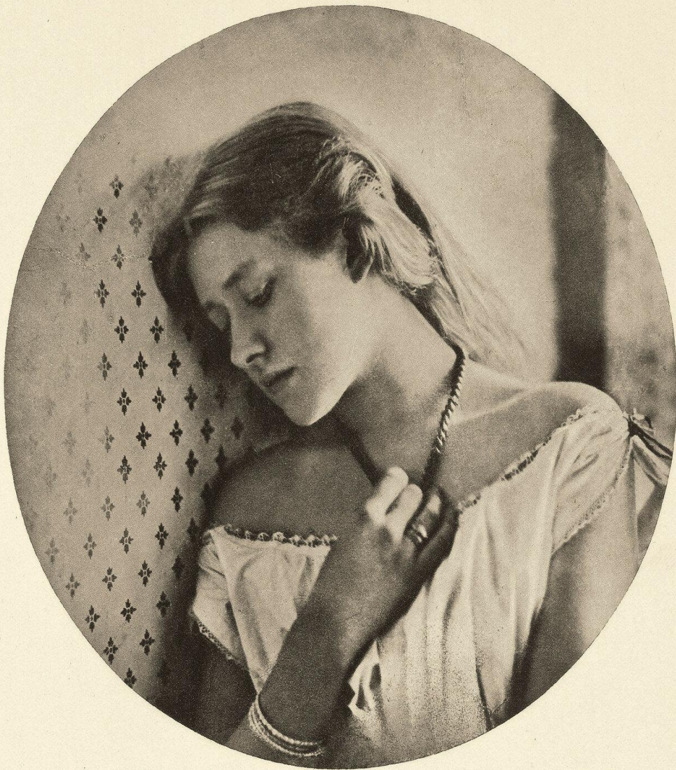
1864. Эллен Терри в возрасте шестнадцати лет