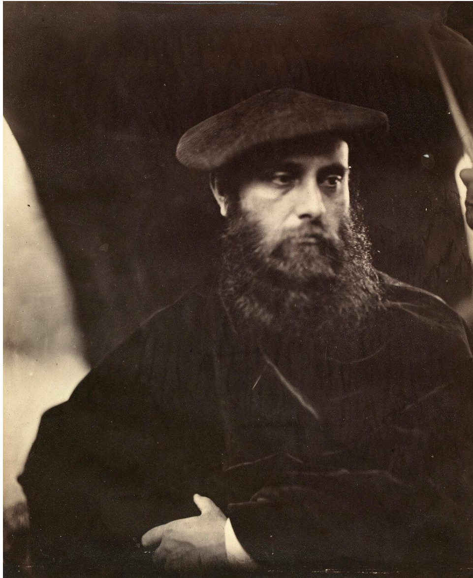
1865. Уильям Майкл Россетти