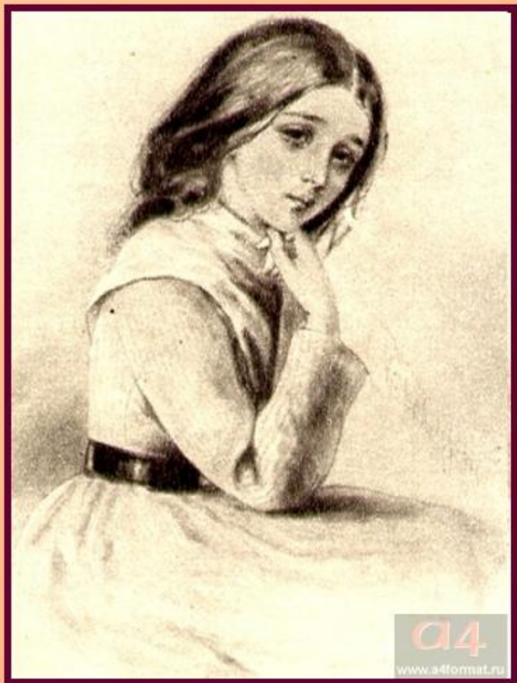
Художник П. Боклевский

Достоевский дал ей имя своей любимой сестры, бывшей на год моложе его и тесно связанной с ним и старшим братом Михаилом дружбой и общими детскими переживаниями и воспоминаниями. Ах, что-то будет со мною, какова-то будет моя судьба! Тяжело то, что я в такой неизвестности, что я не имею будущности, что я и предугадывать не могу о том, что со мной станется. Назад и посмотреть страшно. Там всё такое горе, что сердце пополам рвется при одном воспоминании. Век буду я плакаться на злых людей, меня погубивших!