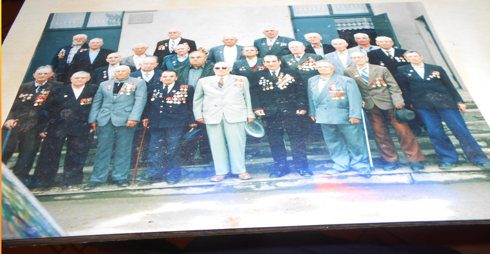
Встреча ветеранов Великой Отечественной войны