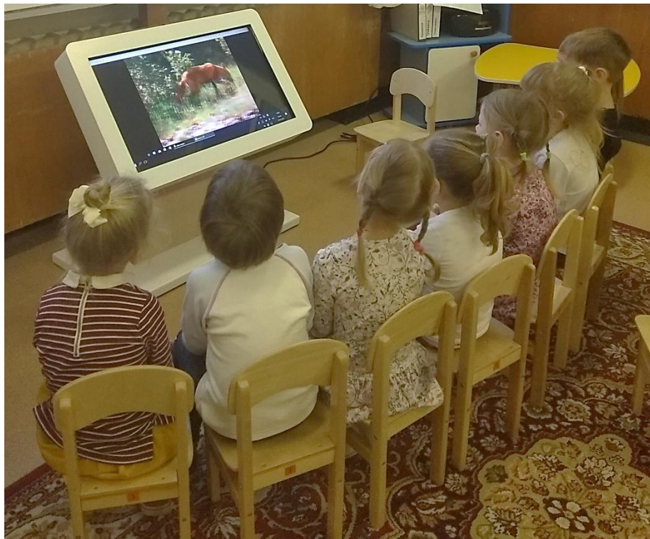
Просмотр видео фильма о жизни лисы в дикой природе