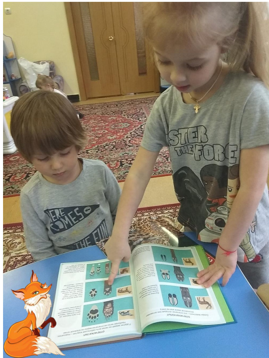
Чтение и рассматривание детской познавательной литературы