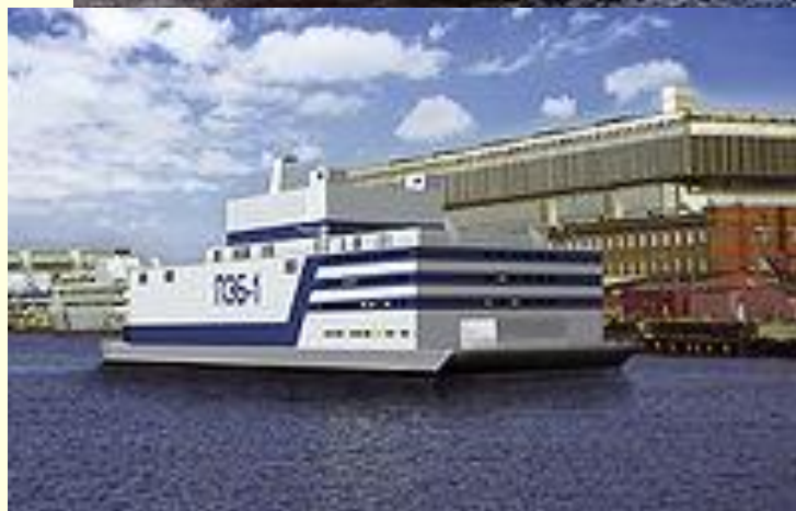
Плавучая атомная эл. станция