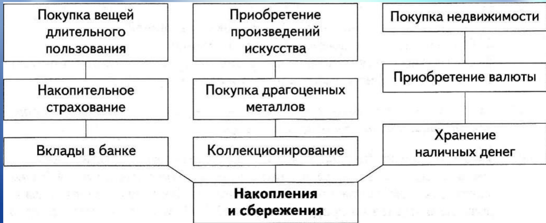
Схема. Способы сбережения денежных средств семьи

Как уже отмечалось, сбережения в семье ВОЗМОЖНЫ ТОЛЬКО при обдуманном планировании семейного бюджета.