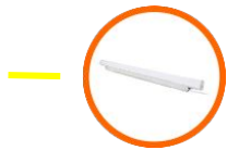
LED Tube Light