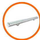
LED Linear Light

Результаты графического исполнения (изображения, произведения графики, дизайна) являются собственностью ООО «Сити Лайт» и охраняются законом.