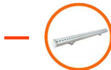
LED Linear Light