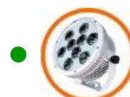
LED Spot Light