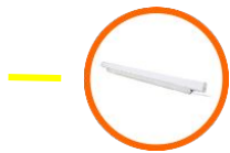
LED Tube Light