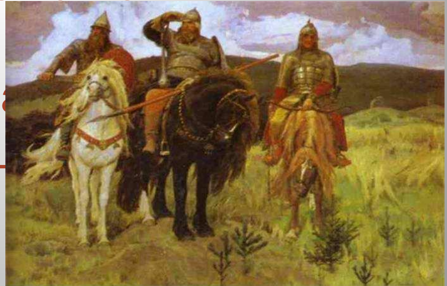
В. Васнецов «Три