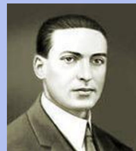
Л. С. Выготский

Так же неслучайно Л. С. Выготский называл рисование - «графической речью».