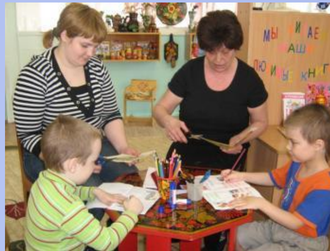
«Вместе дело спориться.»

- Совместная продуктивная деятельность доставляет удовольствие как детям, так и взрослым.