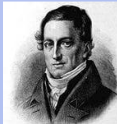
Фихте И. Г.