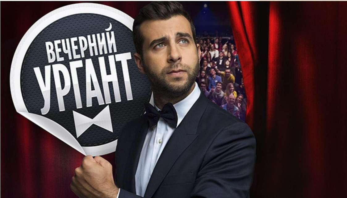
Ток-шоу "Вечерний ургант."