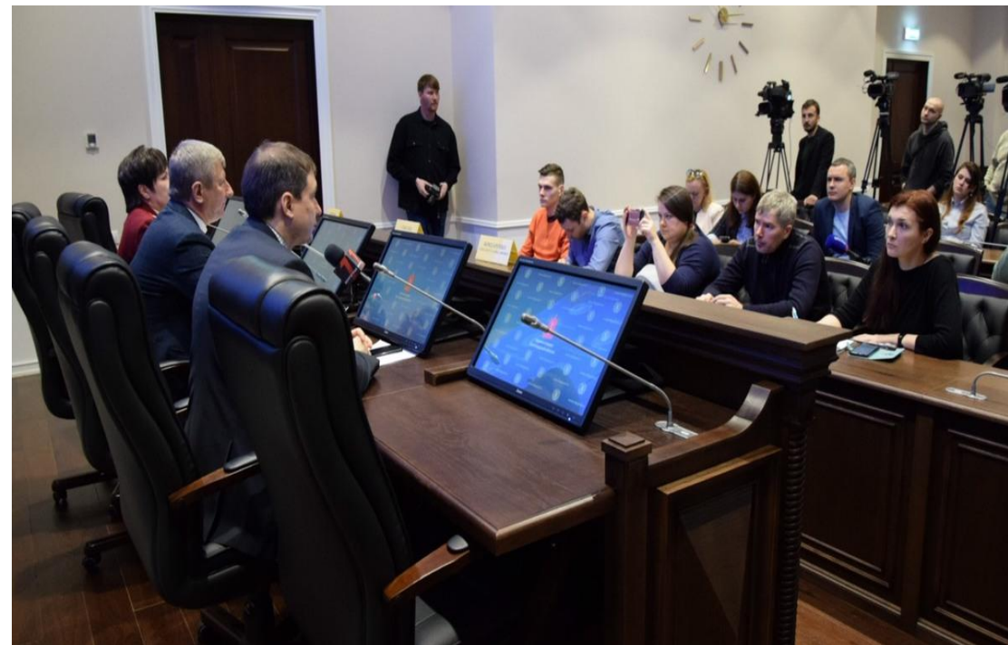
Брифинг по ситуации с коронавирусом в Волгограде.