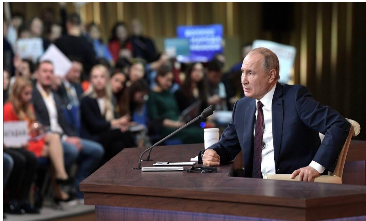
Пресс-конференция Владимира Путина в 2019 году.