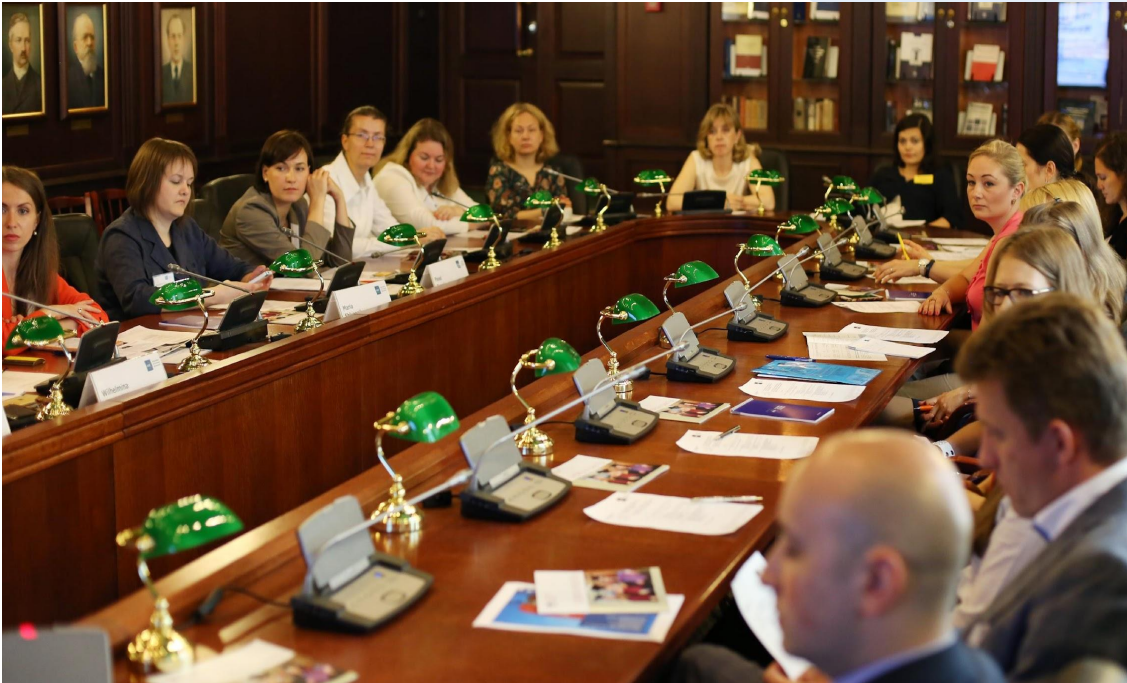
Круглый стол в СПбГУ с членами Ассоциации европейского бизнеса.

4. Круглый стол – коллективное интервью, в котором журналист выступает как организатор («дирижер»). Он приглашает в студию или редакцию людей, которые могут осветить какую-либо проблему с разных сторон, имеют разные точки зрения на один и тот же вопрос. Журналист поочередно дает им слово, следит за корректностью высказываний, задает наводящие вопросы.