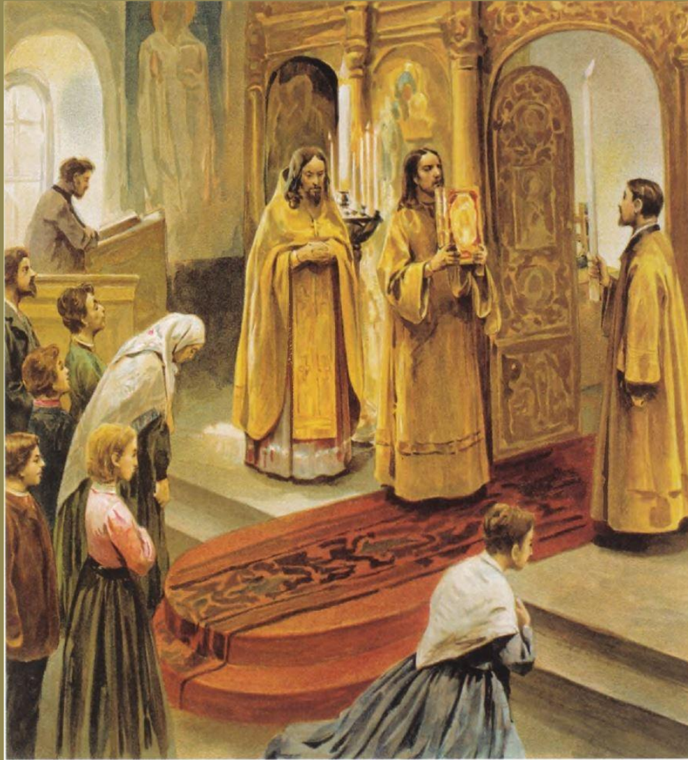
Малый вход с Евангелием

Эта заповедь о том, что чистые сердцем, т.е. люди, имеющие свои сердца чистыми от дурных желаний и помышлений и всегда сохраняющие память о Боге, увидят Самого Бога, что составляет величайшую степень блаженства.