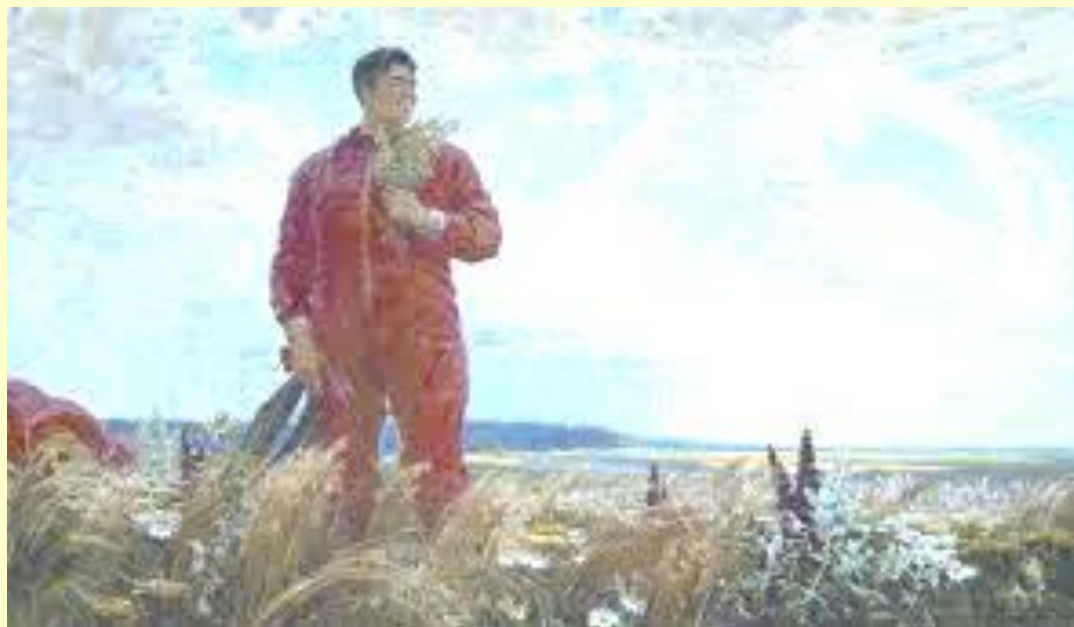
«Салам, Ҷӑр!» картина