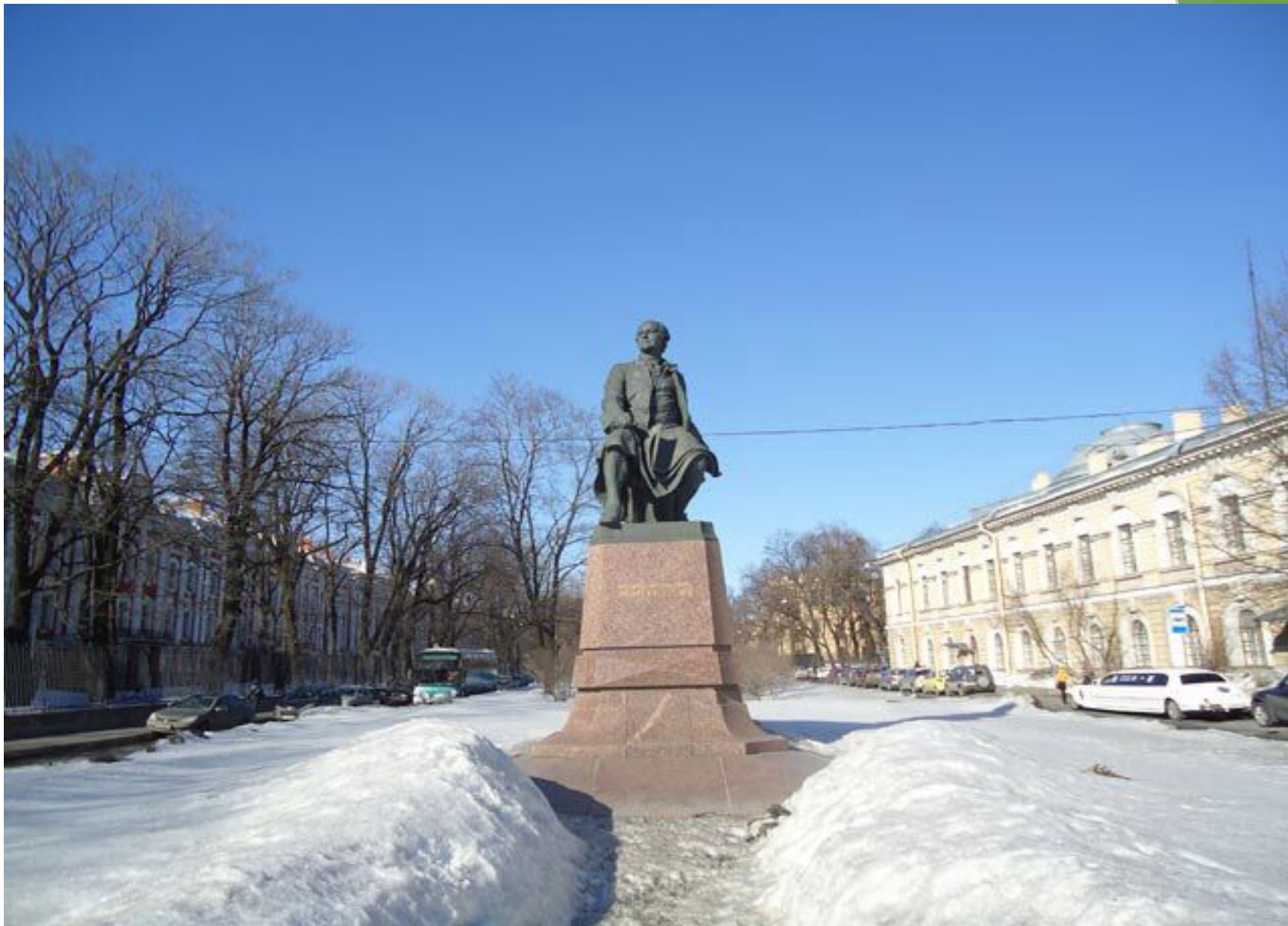
Памятник Ломоносову М.В.. Университетская наб.