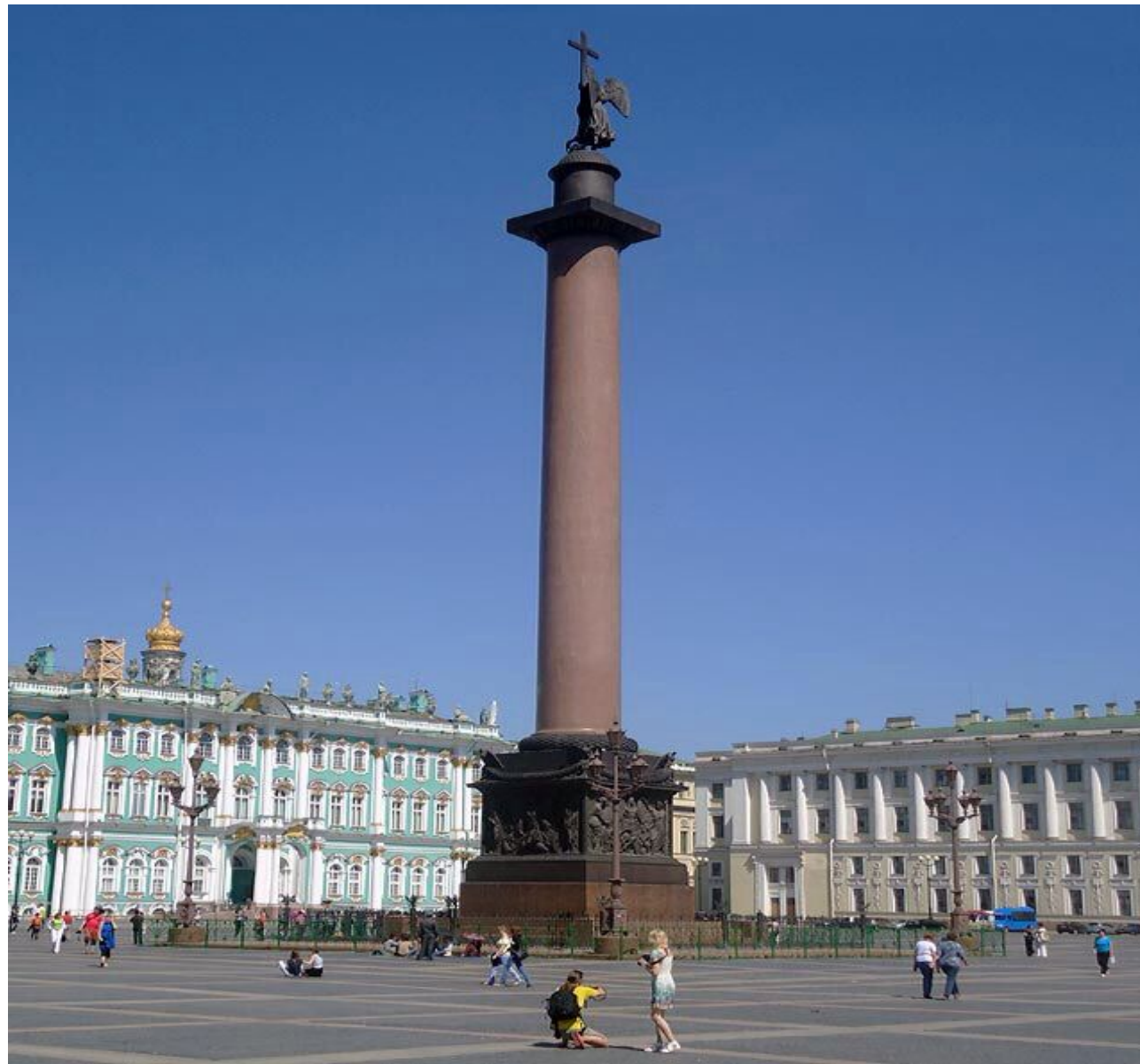
Александровская колонна. Дворцовая площадь. Санкт-Петербург