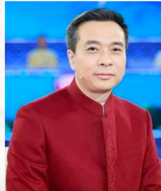
康震 КанЧжэнь Профессор гуманитарной академии Пекинского педагогического университета