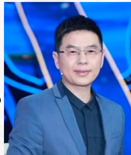
郦波 Ли Бо Профессор факультета литературы в Нанкинском педагогическом университете