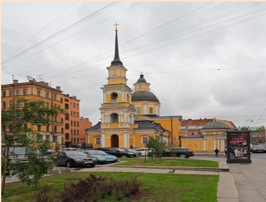
Церковь Симеона и Анны