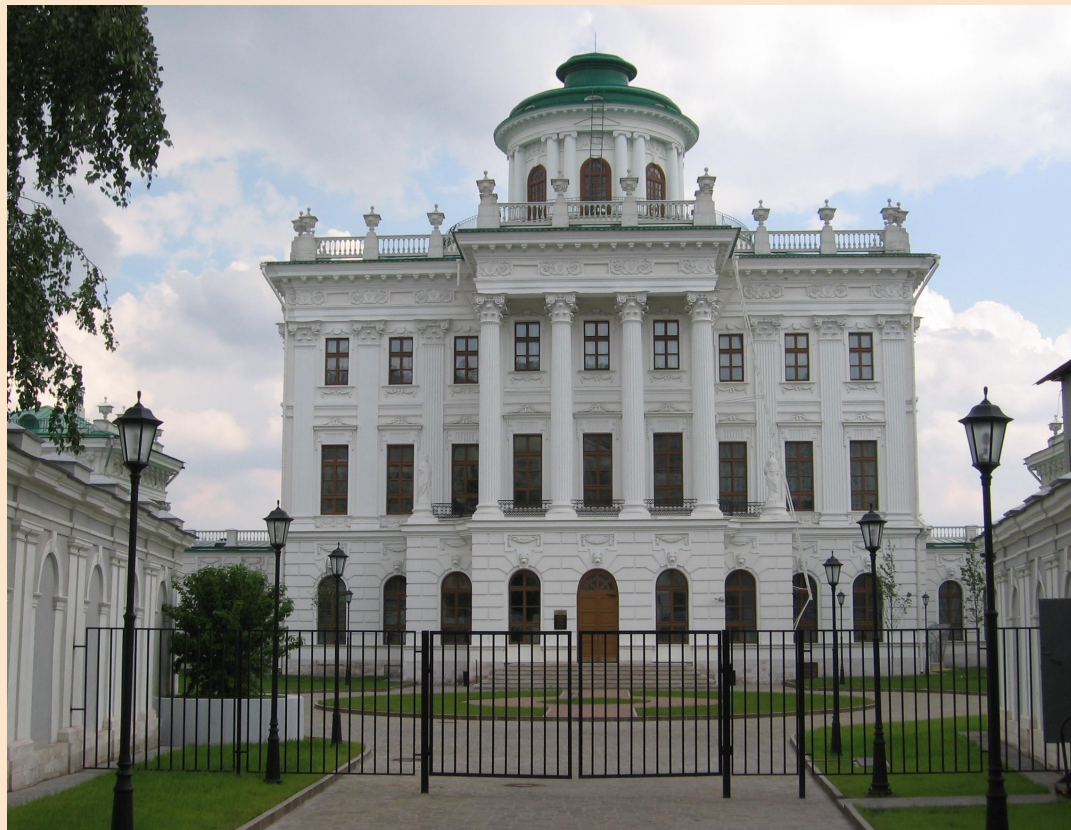
Дом Пашкова в Москве