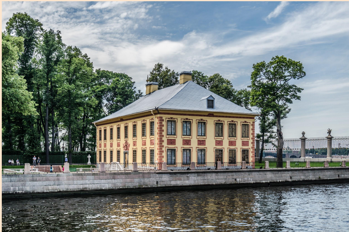
Летний дворец Петра