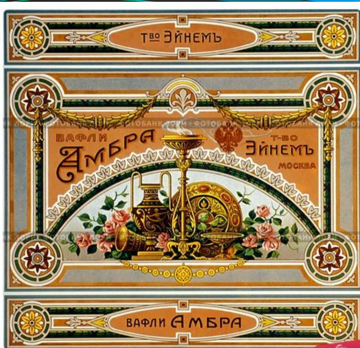
Рекламная этикетка вафли товарищества Эйнем, Москва