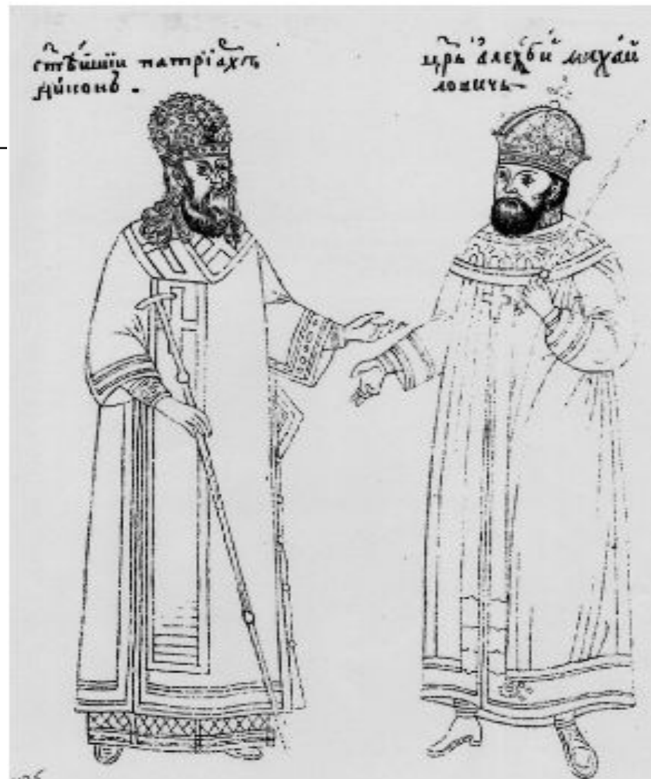
Святейший Патриарх Никон и царь Алексей Михайлович .

Как изменилось соотношение сил духовной и светской власти к концу XVII века? Аргументируйте ответ.