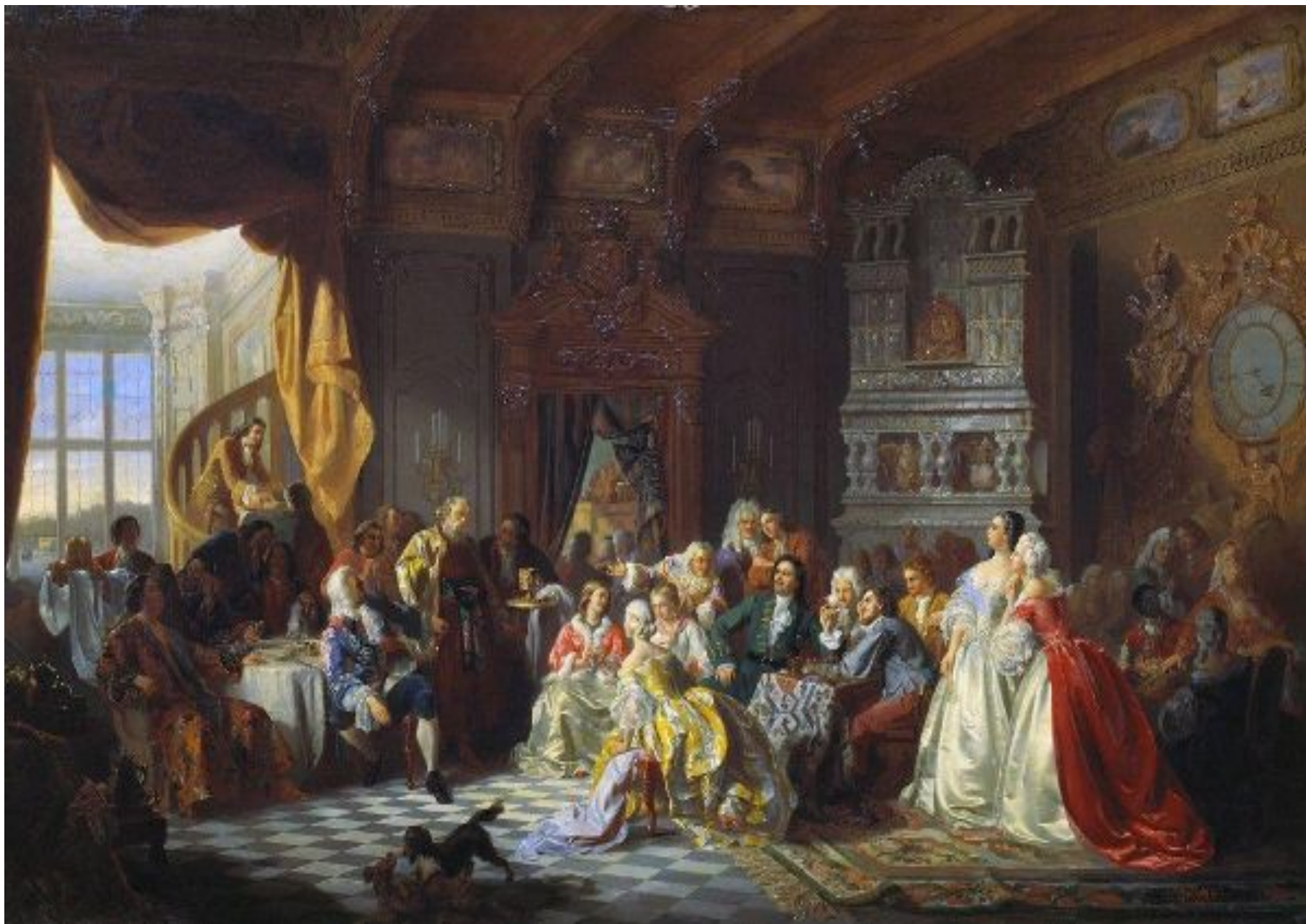
Картина С. Хлебовского «Ассамблея при Петре I»