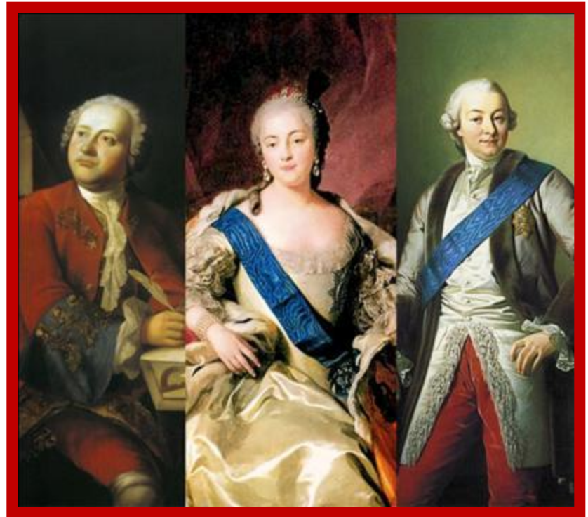
Михаил Васильевич Ломоносов, императрица Елизавета Петровна, Иван Иванович Шувалов.