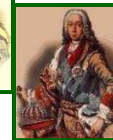
Петр III 1761-1762