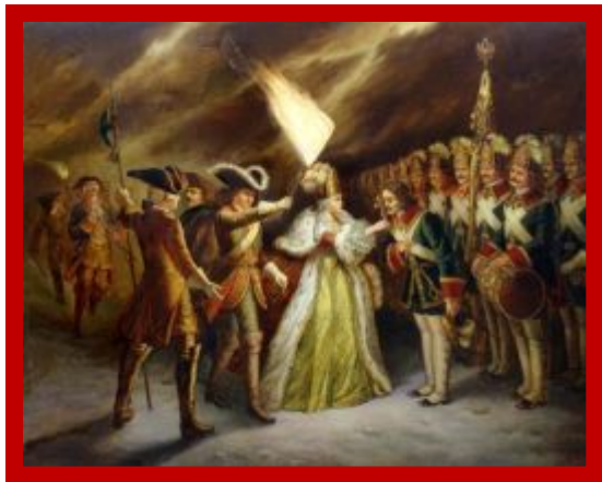
Присяга преображенцев дочери Петра Великого.