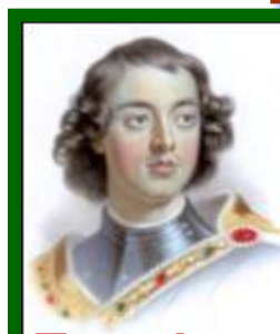
Петр I 1682-1725

Период в истории России с 1725 по 1762 гг.