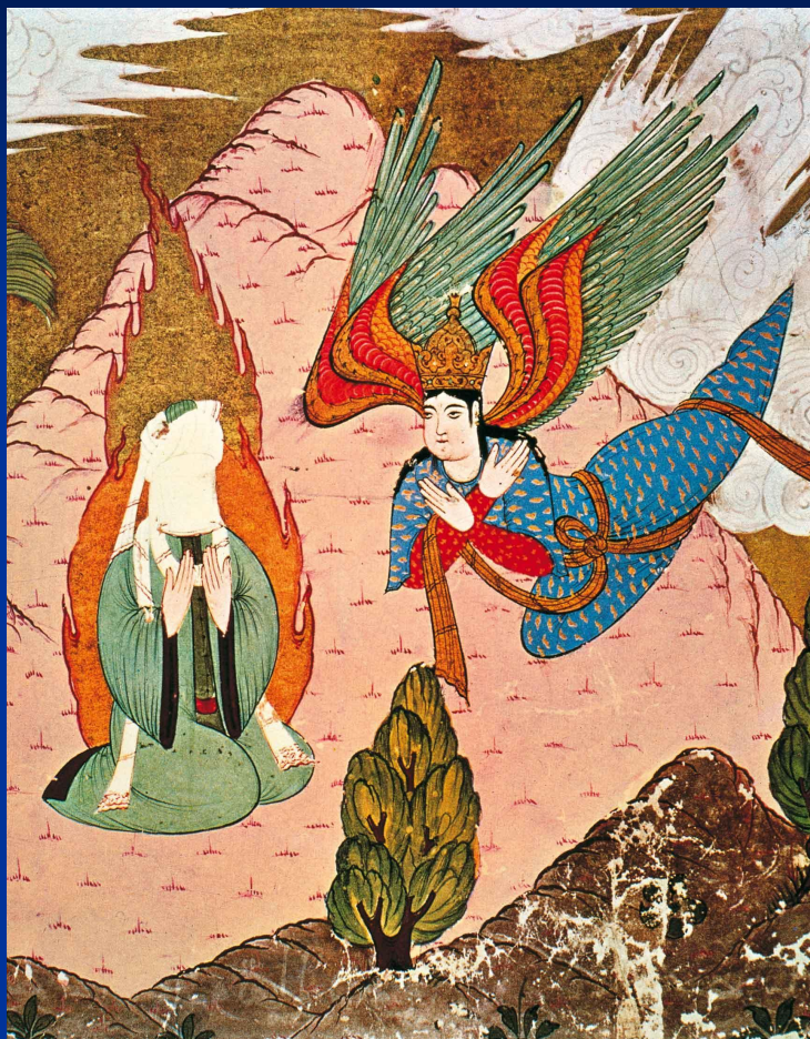
Мухаммед и ангел. Арабская миниатюра