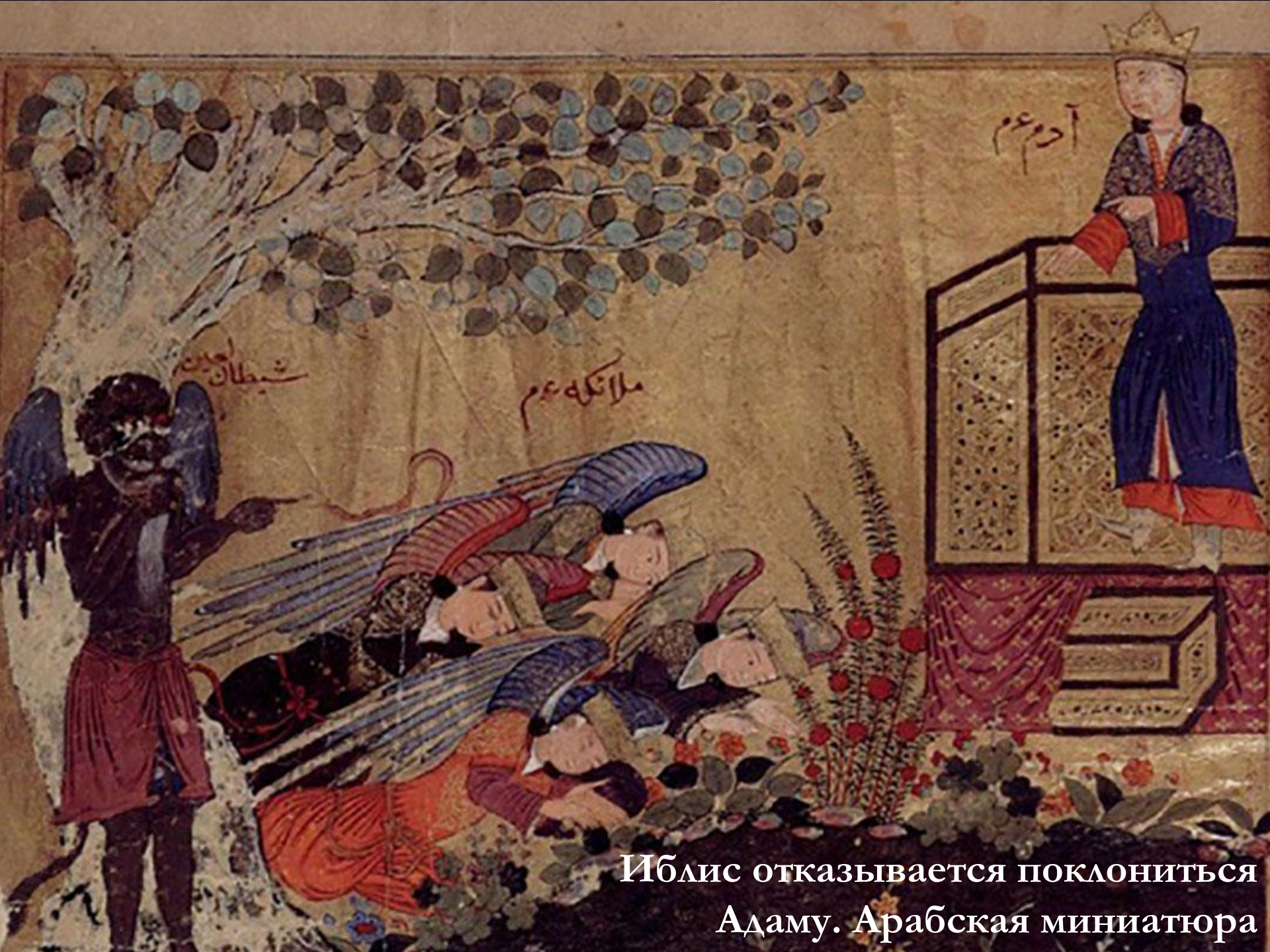
Иблис отказывается поклониться Адаму. Арабская миниатюра