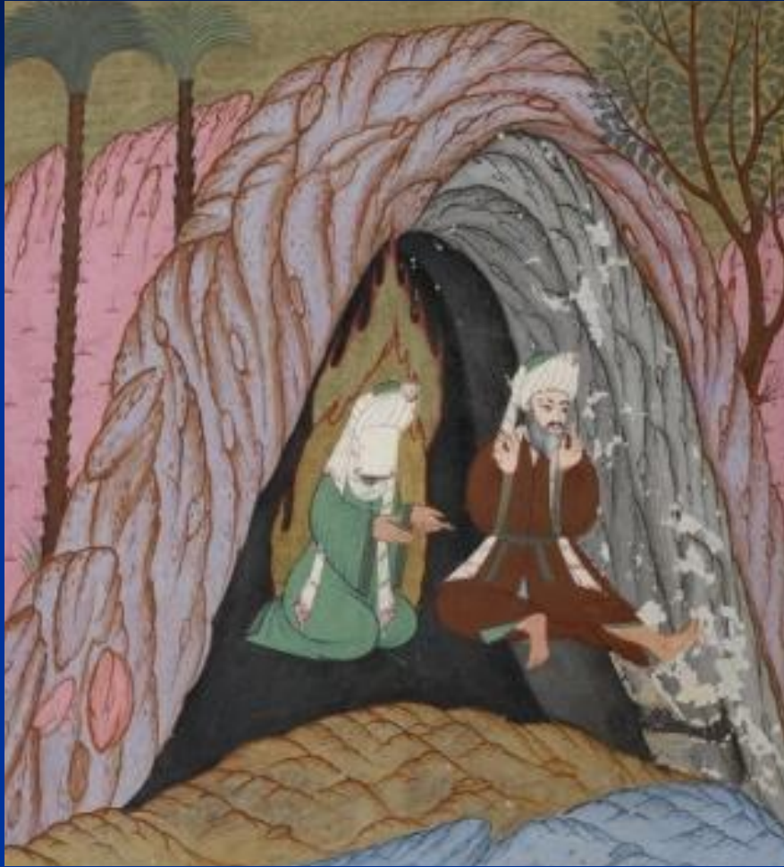
Мухаммед в пещере. Арабская миниатюра

Мухаммед – мусульманский пророк, основатель ислама