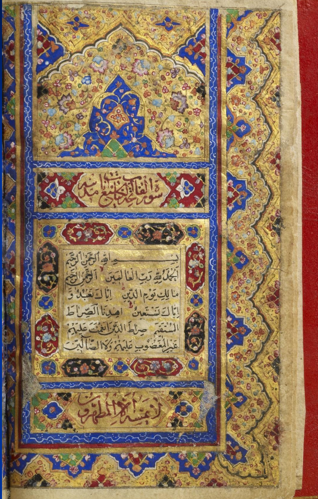
Страница Корана. Рукопись XVII в.

Коран («чтение») – священная книга мусульман, написана на основании высказываний Мухаммеда