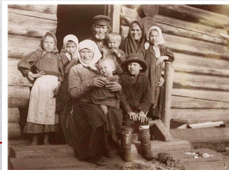
Крестьянская семья из д. Ярки Енисейского уезда в праздничный день на крыльце

в 1914 – 165,7 млн. человек (более 10 % всего населения земли).