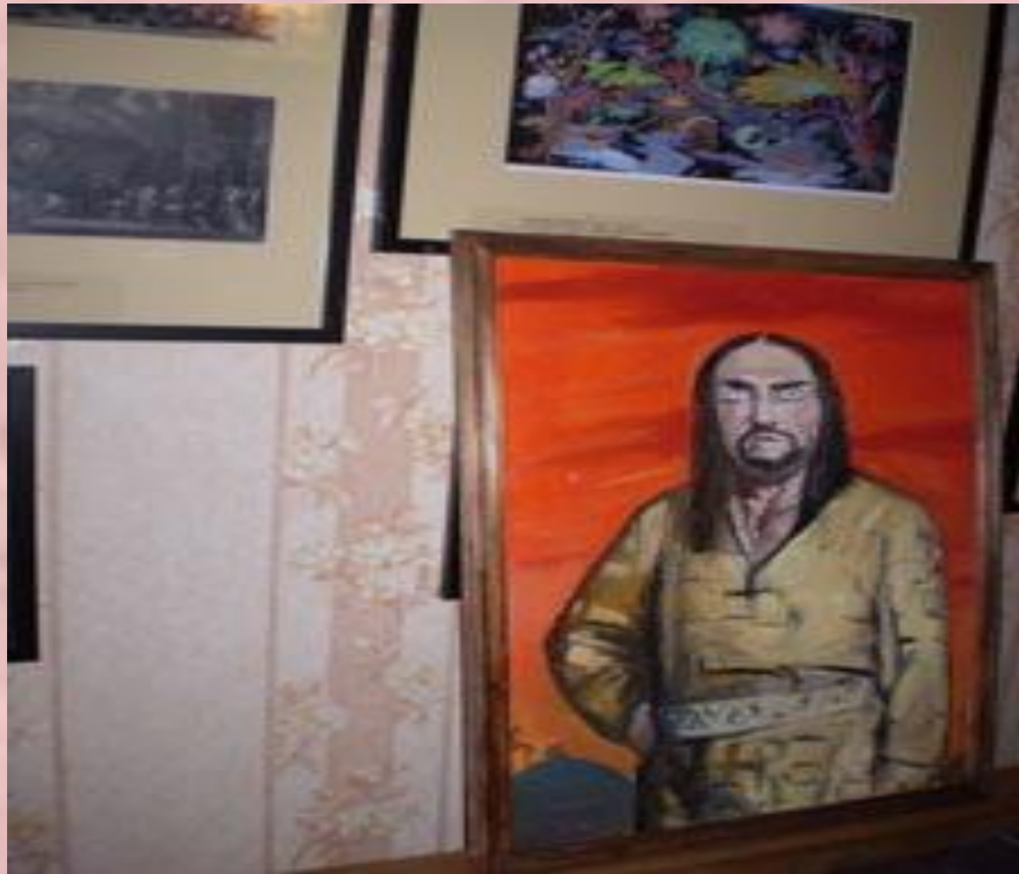
Музей Бахрушина предоставил эскизы к опере «Князь Игорь», фонд Шаляпина преподнёс в дар портрет Шаляпина из оперы «Богатыри»