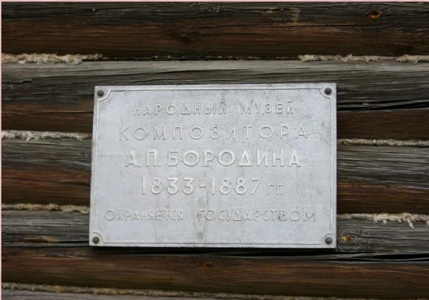
Мемориальная доска на доме, где жили Бородины.