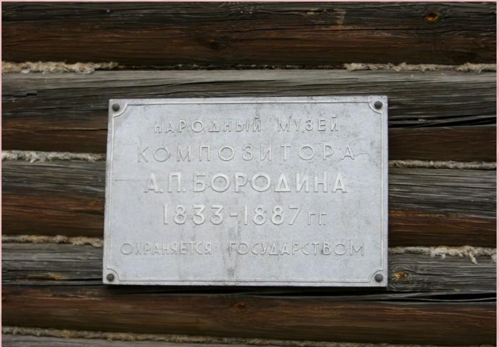
Мемориальная доска на доме, где жили Бородины.