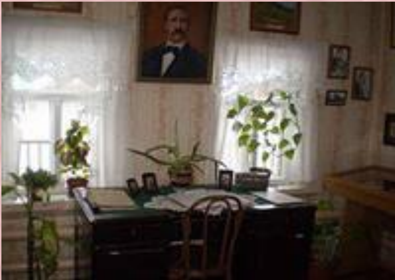
Музей маленький, но экспонатов здесь много. Картины, афиши спектаклей и концертов по мотивам произведений Бородина.