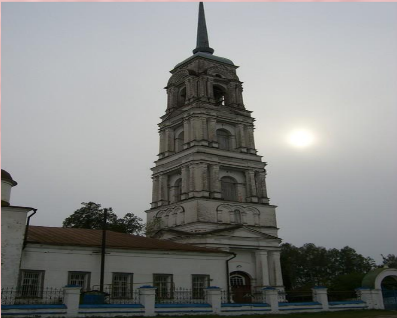
Недалеко от села стоит большая церковь Спаса Преображения построенная в 1841 году, где бывал Бородин