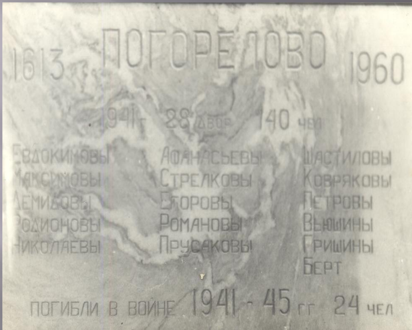
Мраморная плита обелиска со списком семей д. Погорелово (1980г)