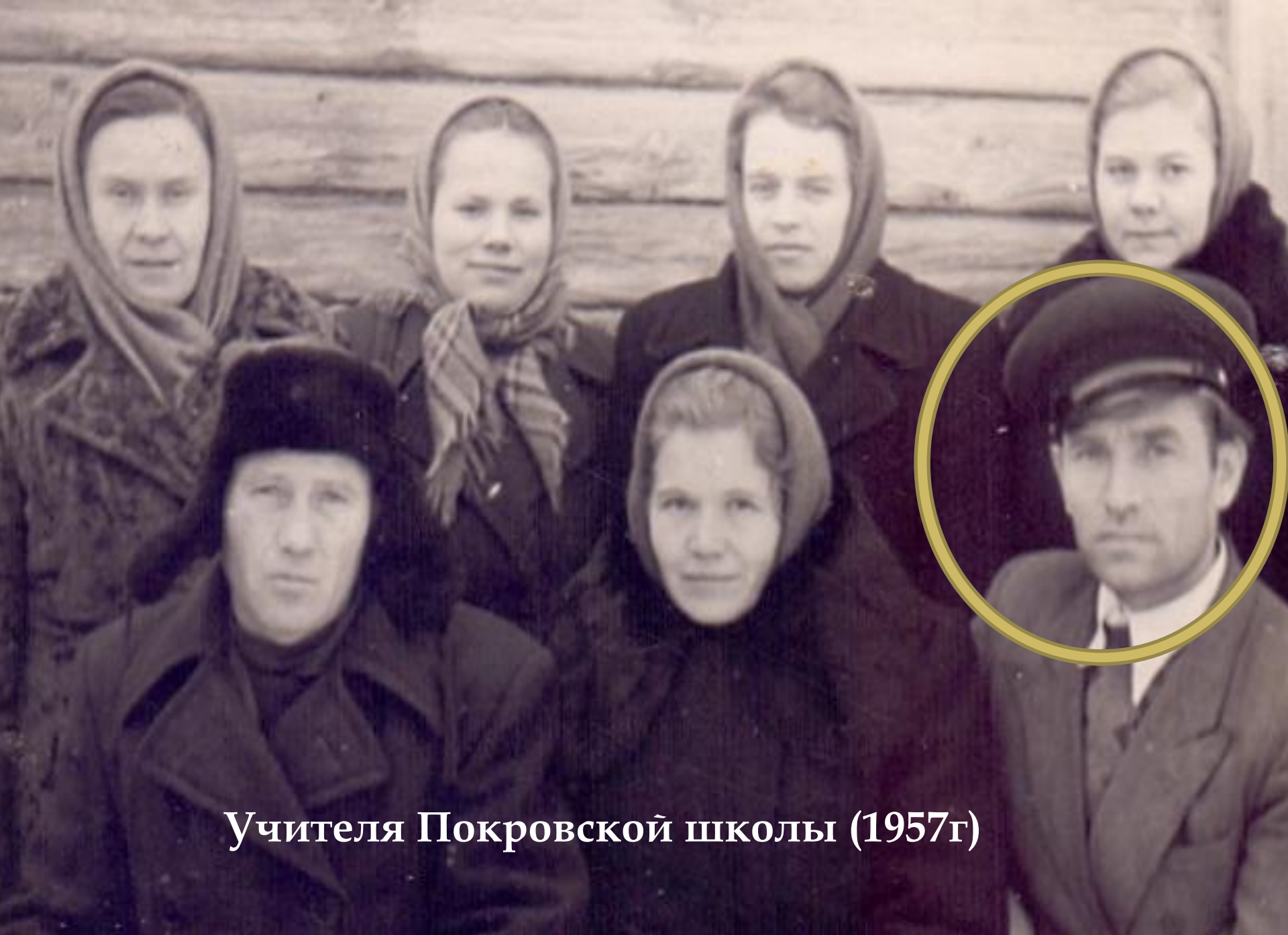
Учителя Покровской школы (1957г)