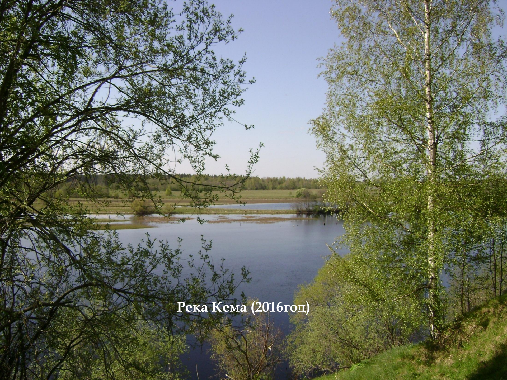
Река Кема (2016год)