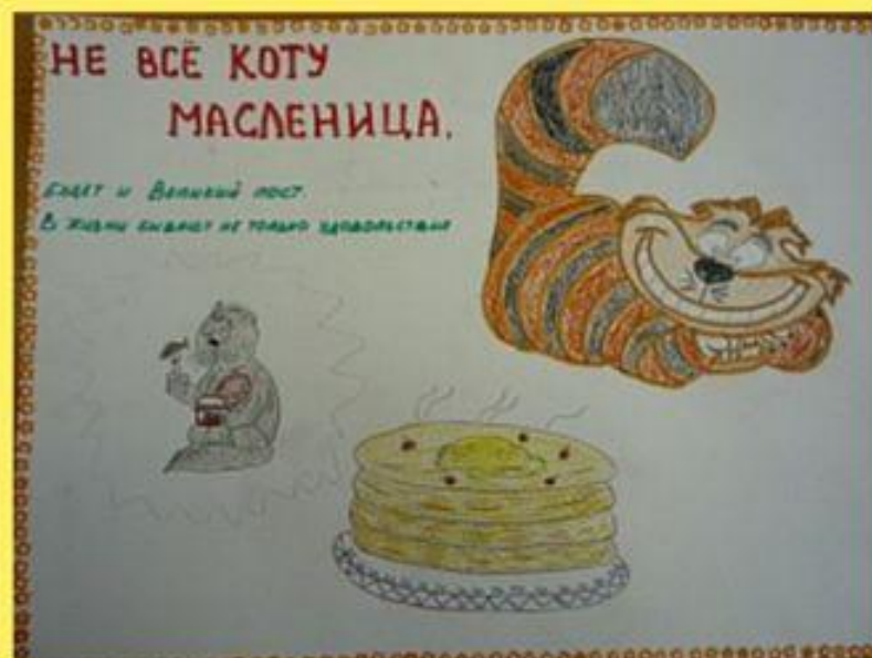
Рисунок выполнила Пустоленко Вероника