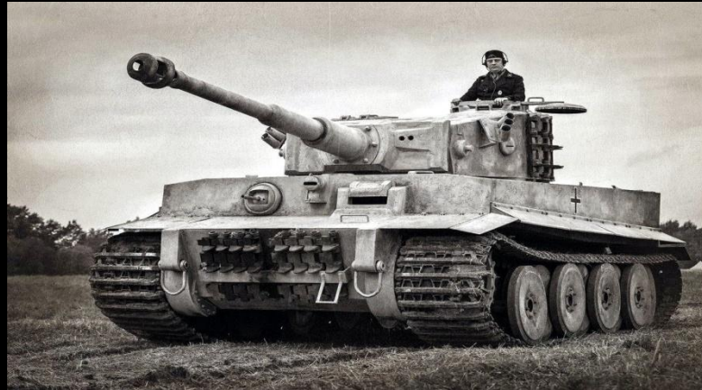
Panzerkampfwagen VI Ausf. E ("Тигр")