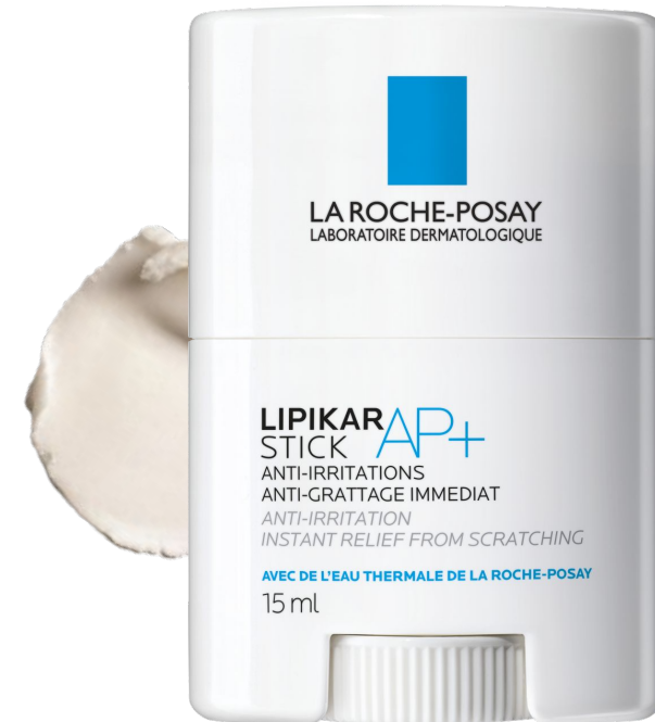
Ліпікар Стік АП+ Заспокоюючий відновлюючий засіб