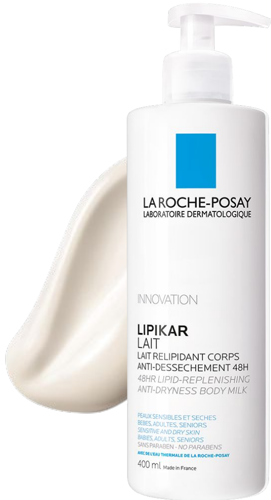
Ліпікар Молочко Ліпідовідновлюючий зволожуючий засіб