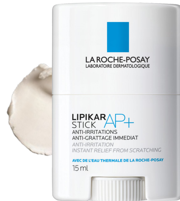
Ліпікар Стік АП+ Заспокоюючий відновлюючий засіб