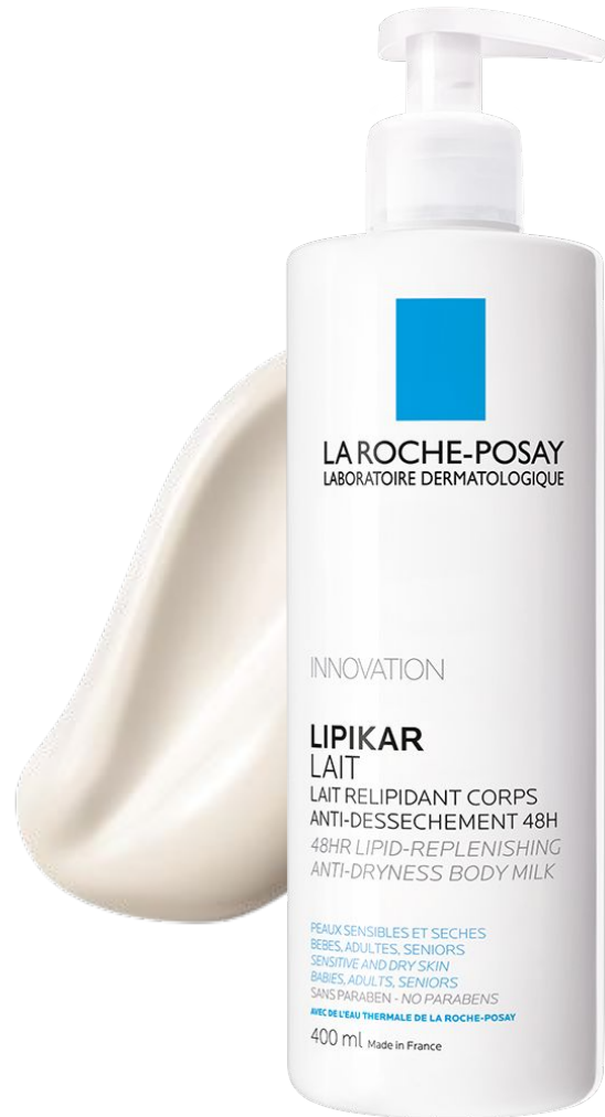
Ліпікар Молочко Ліпідовідновлюючий зволожуючий засіб