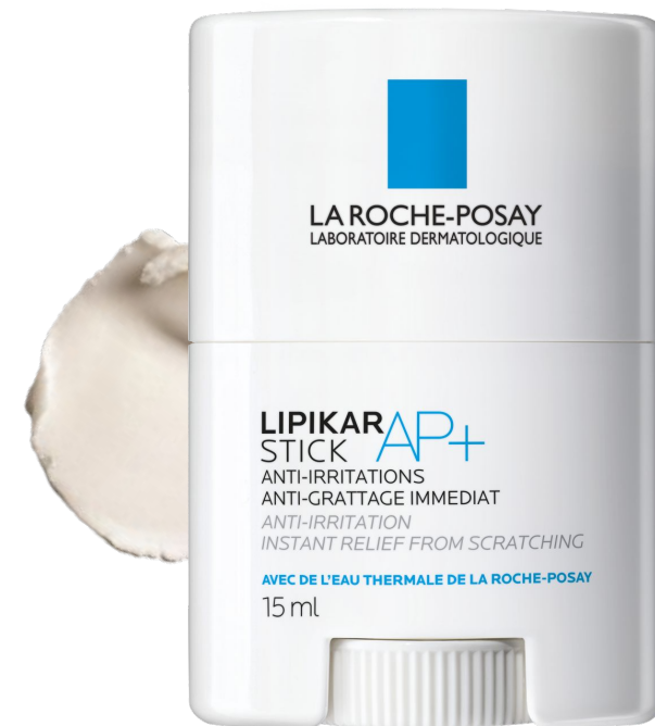
Ліпікар Стік АП+ Заспокоюючий відновлюючий засіб