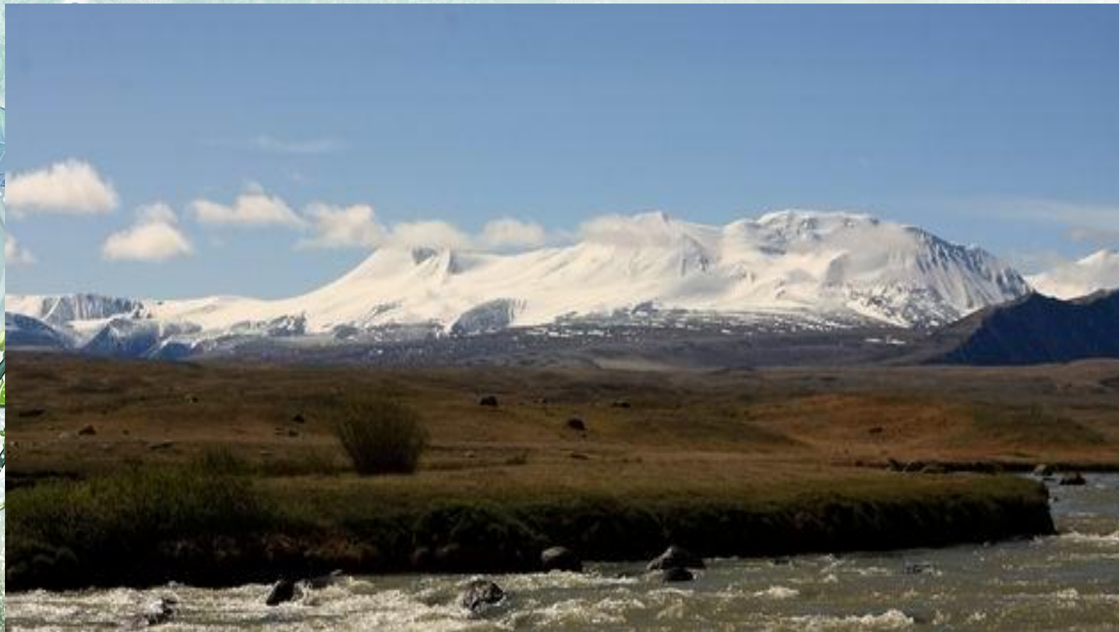
Плато Укок (Алтай)

Горы и труднодоступные районы мира до сих пор хранят тайны, которые человечеству еще предстоит раскрыть.