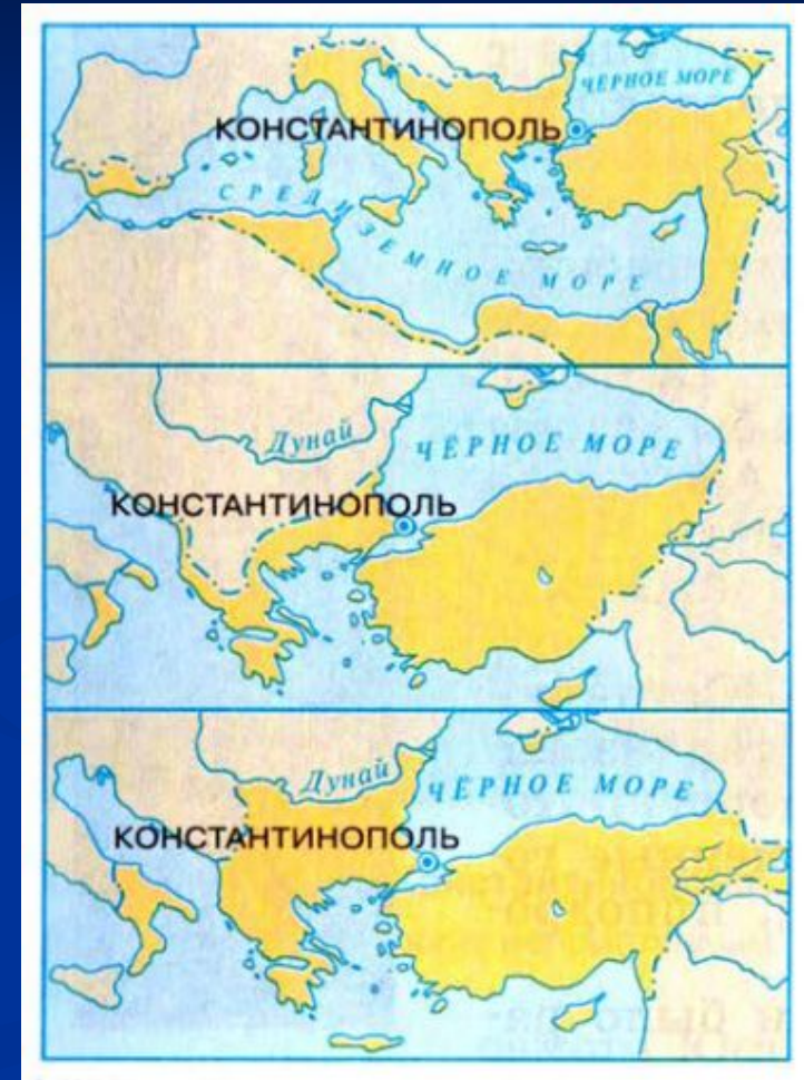
Византия в VII – XI вв. Карта

Постепенное ослабление и потеря территорий