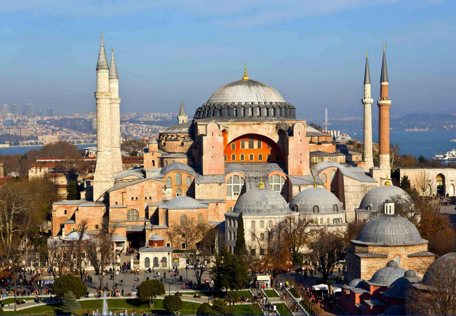
Собор Святой Софии. Современное фото