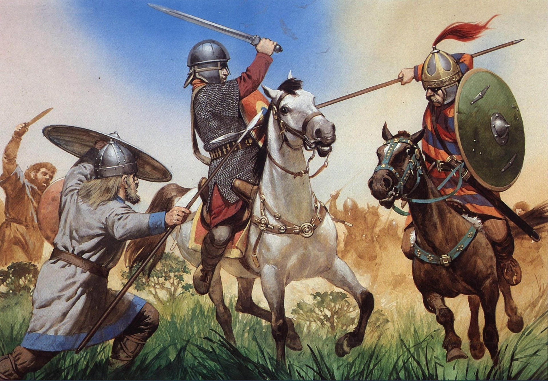
Битва византийцев с готами. Рисунок