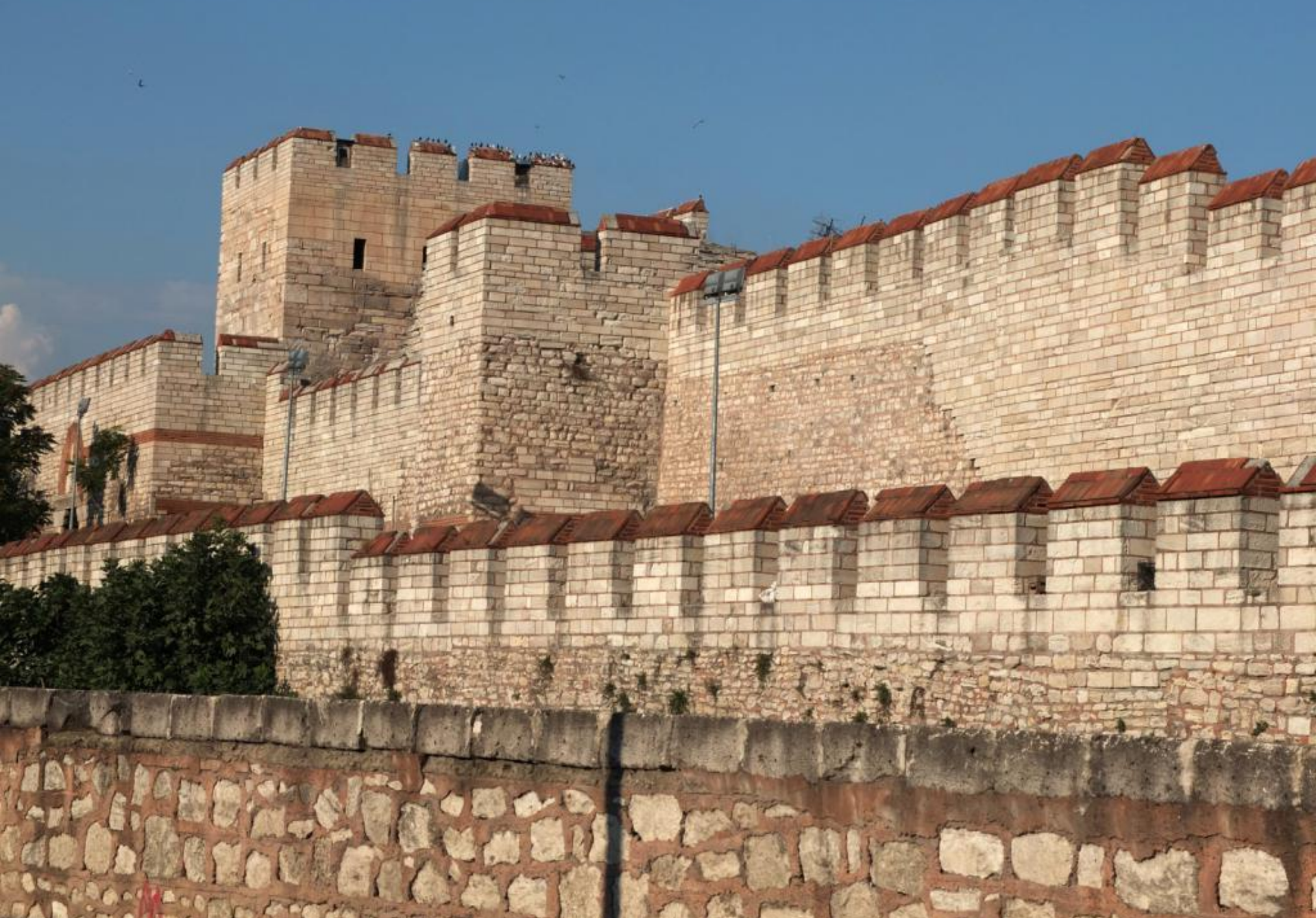
Городская стена Константинополя. Фото