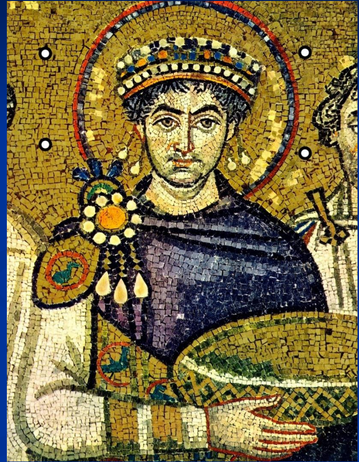
Юстиниан. Византийская мозаика