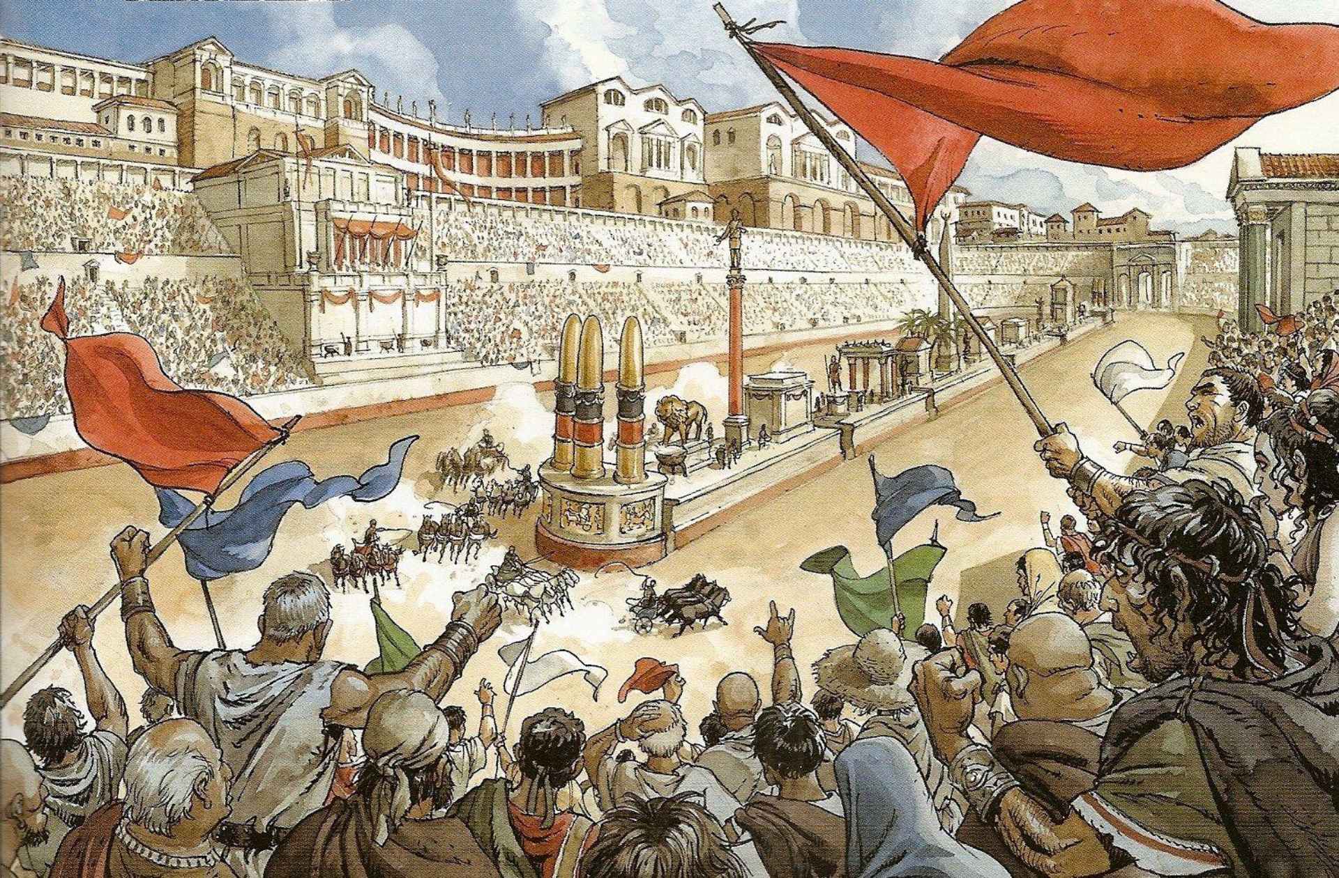
На ипподроме Константинополя. Рисунок