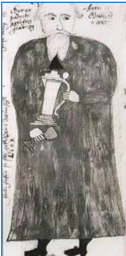
Квасир на средневековой гравюре

Деревни или села имели свой питейный дом или корчму, где подавали пиво, брагу, меды, квасы.