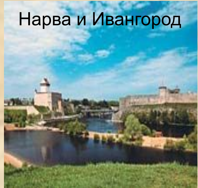
Нарва и Ивангород

Войны со шведами продолжались и после присоединения Новгорода к Москве. В 1496 г. Иоанн III заключил союз с датским королем отправил трех