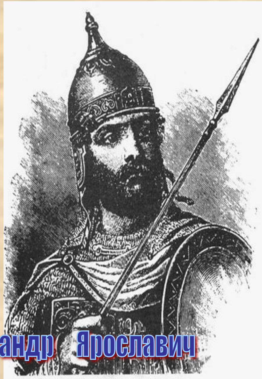
Князь Александр Ярославич