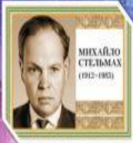
МИХАЙЛО СТЕЛЬМАХ (1912-1983)

Я простий сіроокий хлопчина – Син своєї нової землі, На мені галіфе з полотниці, І мені славно жити в селі. ... тут сонце нанизує дні На жита, на червону пшеницю, На гаї і на юність мою, І тому, як в казкову жар-птицю, Я закоханий в землю свою!