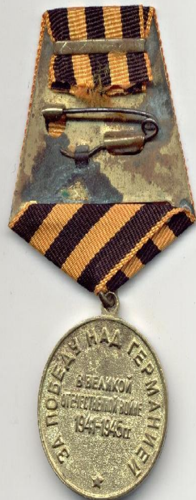
Медаль за победу над Германией.