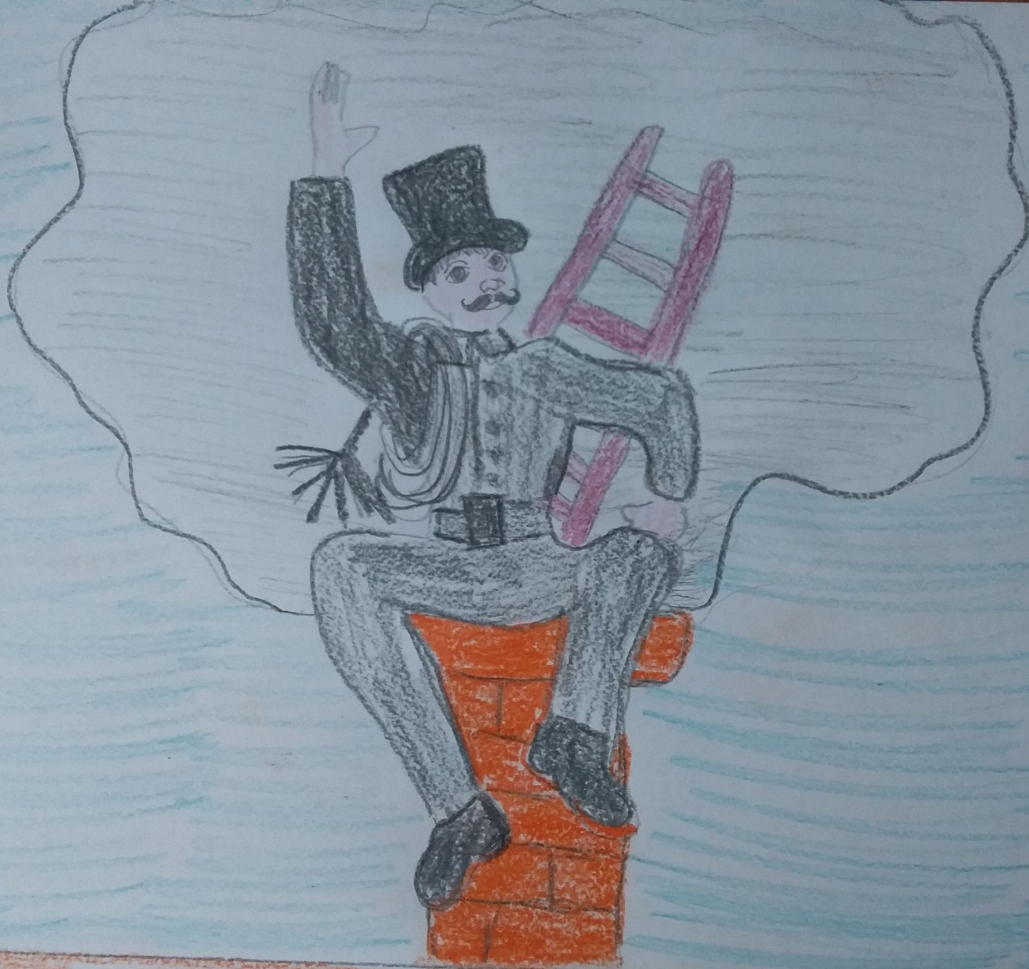
Ломова Вероника, 8 лет