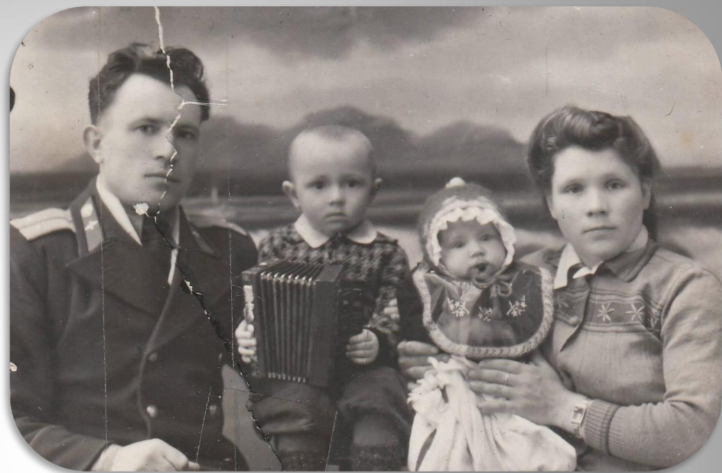
С женой и детьми. 1947 год

Возвратившись с войны Обустроил дела И хозяйку нашёл поскорей Через год она сына ему родила, А потом еще двух дочерей