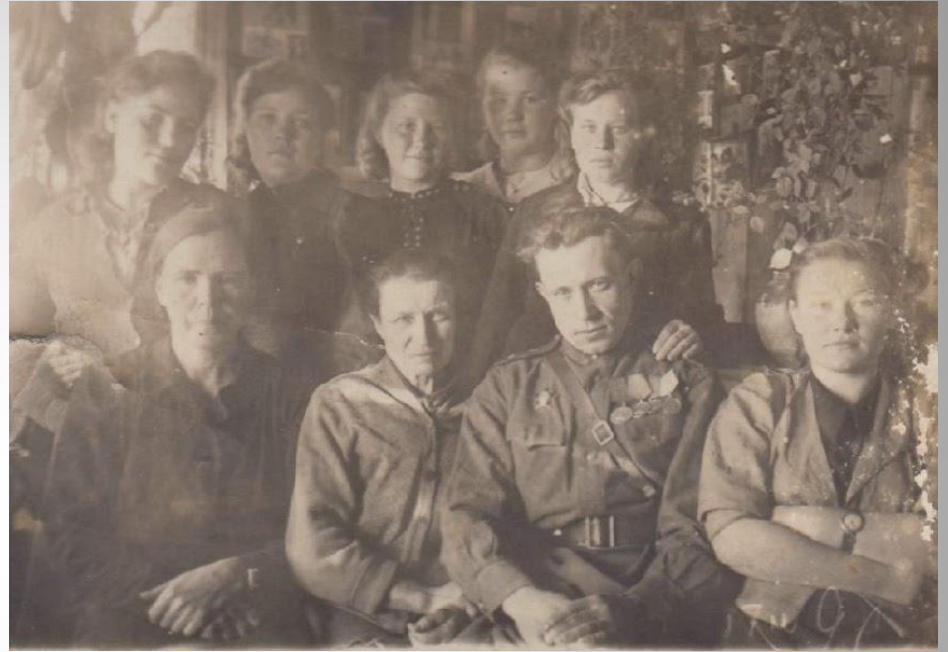
С матерью и сестрой